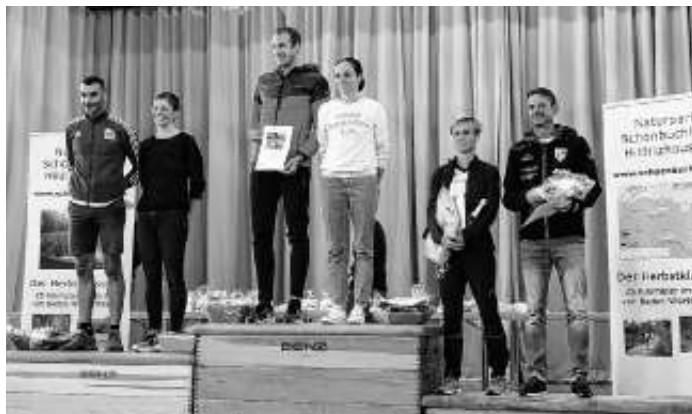
Das Podest mit den Gesamtsiegern

Auch die Verpflegung in der Halle wurde super angenommen. Kuchen, belegte Brötchen und Maultaschen halfen, die geleerten Energiespeicher wieder aufzufüllen.