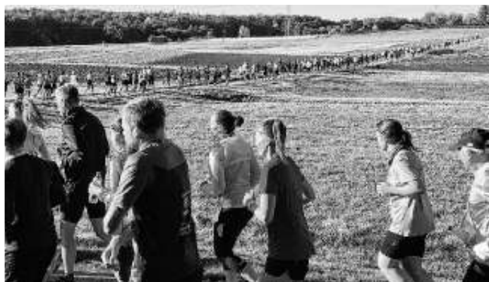
Gleich nach dem Start biegt die Läuferchlange ab

Nachdem im Vorjahr unmittelbar nach der Pandemie die Teilnehmerzahl beim Schönbuchlauf auf ein Minimum gefallen war, entschloss sich die Laufgruppe des TSV zu einer gravierenden Änderung bei den Strecken. Anstelle einer Zweierstaffel, bei der sich zwei Teilnehmer die 25 km teilen, wurde ein Einsteigerlauf über 10 km Länge ins Programm genommen. Wer sich für diesen entschieden hatte, zweigte nach etwa 5 km von der großen Runde ab und erreichte über die idyllische „Saufangklinge“ ziemlich direkt das Ziel. Die Staffelwertung selbst wurde durch eine Kombiwertung ersetzt, für die die Zeiten eines 25 km-Läufers und eines 10 km-Läufers (... oder einer Läuferin), die sich zusammen angemeldet hatten, addiert wurden.