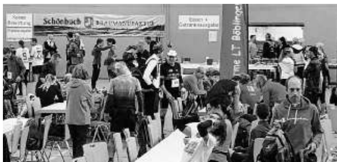
Vor dem Start herrscht reger Betrieb in der Halle

Der Dank der Laufgruppe gilt allen Helferinnen und Helfern an der Strecke und im Hallenumfeld (Familien, Freunden, Bekannten der Laufgruppe, dem Therme Lauftreff Böblingen und dem Lauftreff des VfL Herrenberg), des weiteren auch dem Bauhof, dem Hausmeister, den Besitzern der als Parkplatz genutzten Wiesen und der Gemeinde Hildrizhausen mit ihren Mitarbeitern. Ebenso der Dank an das DRK Holzgerlingen/Altdorf, das die Läufer unterwegs betreute, und die Funkgruppe der DLRG Böblingen, die die Funkinfrastruktur dafür bereitstellte.