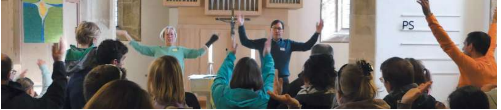
Bewegender Familiengottesdienst in der Breitensteiner Georgskirche.

Fast 70 große und kleine Teilnehmer/innen bei "Kirche kunterbunt" in Breitenstein