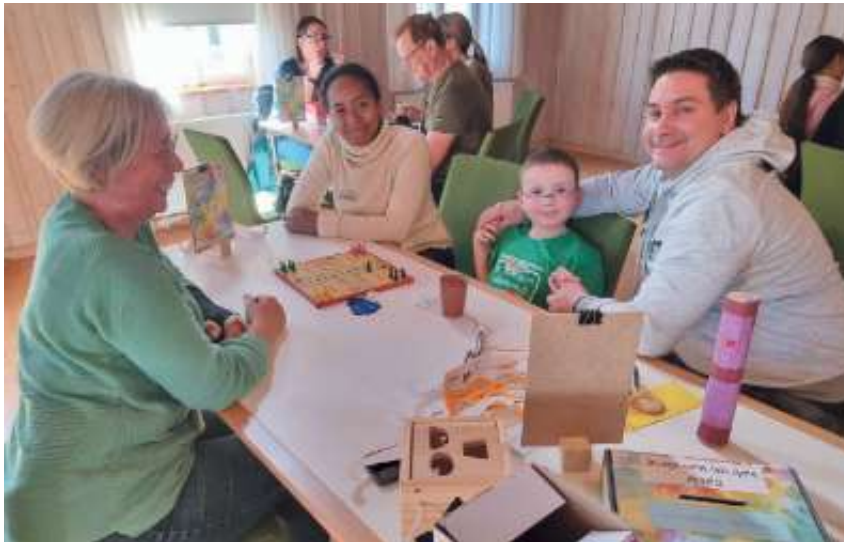
Gemeinsamer Spielspaß ...

Aktiv sein bei Spiel- und Bastelangeboten im Gemeindehaus, ein beschwingter Gottesdienst in der Georgskirche und hinterher das leckere Mittagessen rundete den gemeinsamen (Vor)Mittag ab, bei dem es unter anderem auch darum ging, mittels Augenklappe oder Spezialbrille hautnah zu erfahren, wie es ist, wenn ein Sinn nicht mehr zur Verfügung steht.