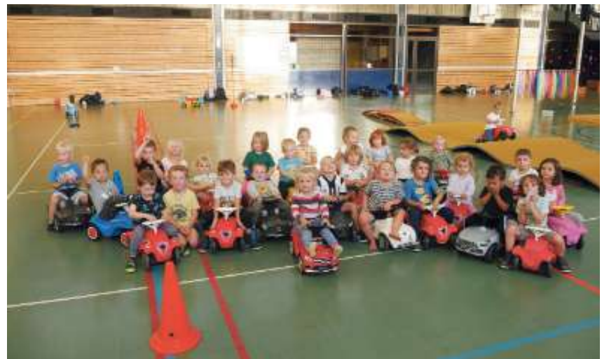
In zwei Gruppen absolvierten die Weiler Handballzwerge ihren "Bobby Car-Führerschein" und zeigten ihn hinterher auch gleich sichtlich stolz vor.