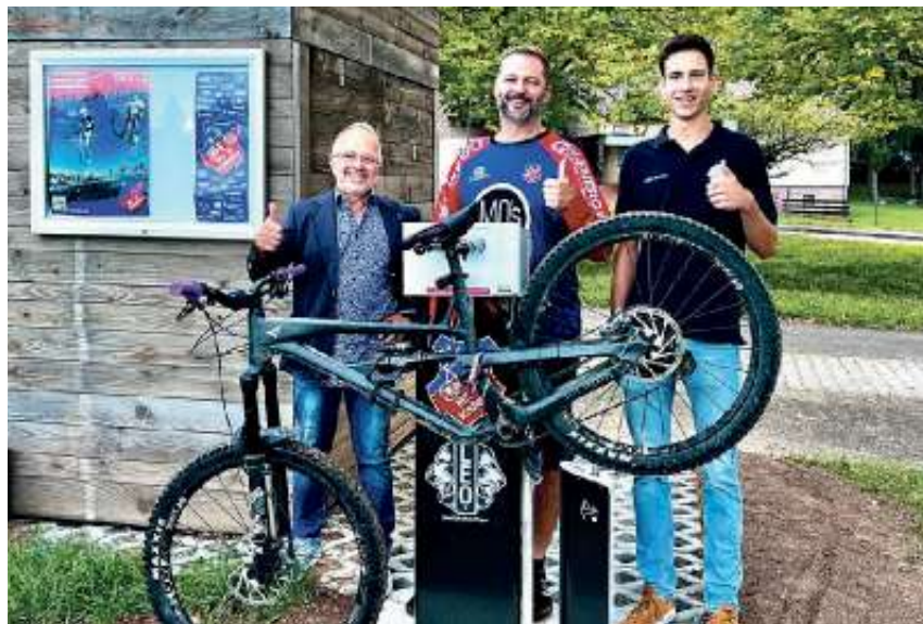
Daumen hoch für Servicestation ...

Texte und Fotos: Holger Schmidt / privat