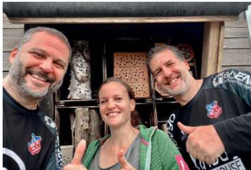
... und Wildbienenhotel.