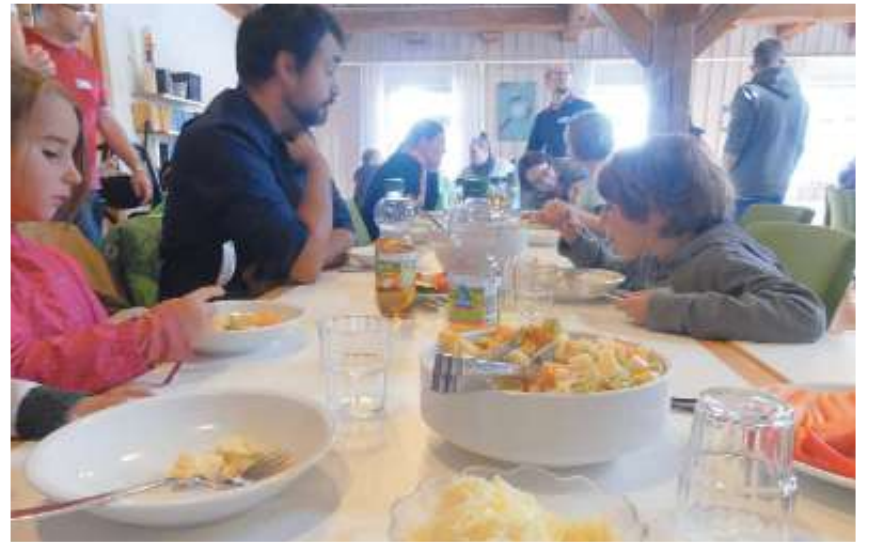
... und zum Abschluss ein leckeres Mittagessen.

Weiler Handballzwerge machen den Bobby Car-Führerschein