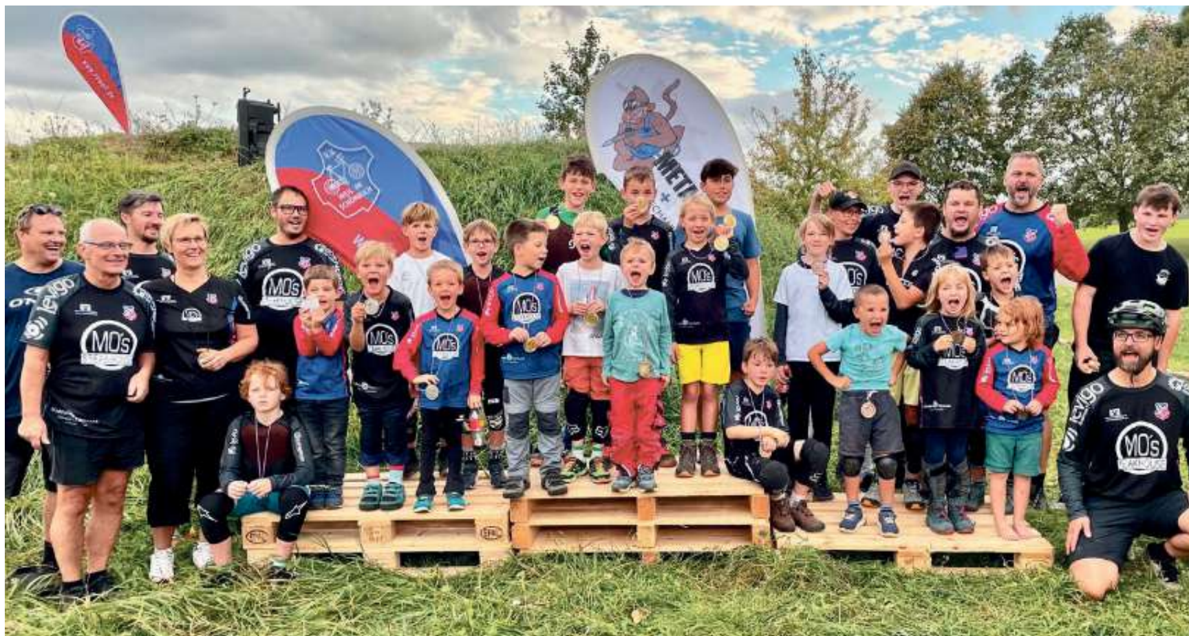
Große Freude bei den Siegern und Platzierten der ersten Mountainbike-Vereinsmeisterschaften beim RV Weil im Schönbuch.

Von Vereinsmeisterschaft bis Servicestation - viel Neues am Dirtpark in Weil im Schönbuch