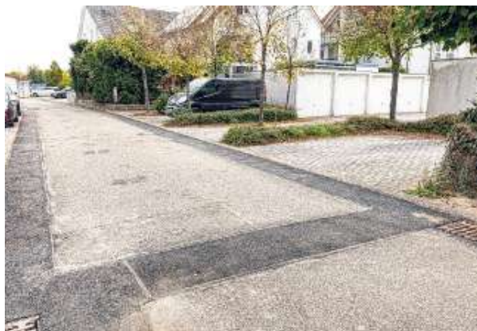
Die wieder hergestellte Asphaltoberfläche in der Straße „Am Rötlesberg“. Hierdurch ist sichergestellt, dass der Winterdienst auch durchgeführt werden kann.

Auch nach dem positiven Ersteindruck der Baufirma wird der Ausbau weiterhin nur in kleinen Bauabschnitten freigegeben. Dadurch soll sichergestellt werden, dass beim Bau entstandene Schäden nicht zu Lasten der Gemeinde saniert werden müssen.