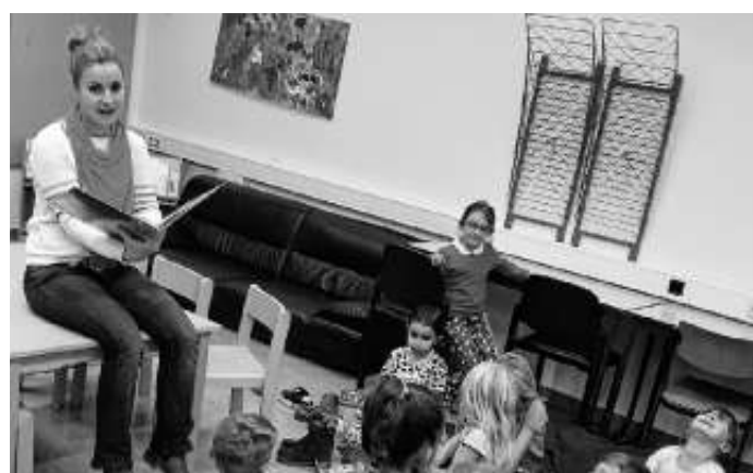
Conni liest vor

Auch dieses Jahr findet das landesweite Literatur-Lese-Fest statt. Und die Schulbücherei ist dabei! Conni hat die lustige Geschichte „Wenn ich groß bin, werde ich Fledermaus“ vorgelesen.