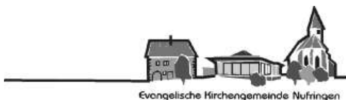
Evangelische Kirchengemeinde Nufringen

Wochenspruch: Lass dich nicht vom Bösen überwinden, sondern überwinde das Böse mit Gutem. Römer 12, 21