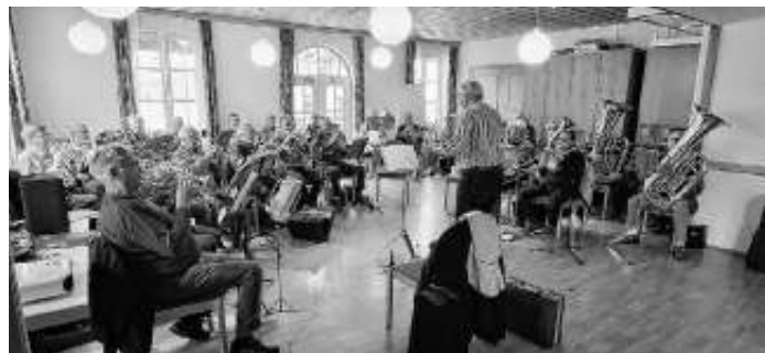
Herbstprobe im Gemeindehaus

Im Anschluss gabs Kaffee und Kuchen und sicherlich eine Menge zu erzählen.