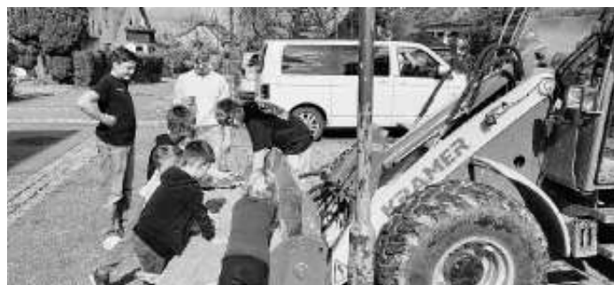
Buddeln in der Baggerschaufel, das war einer der coolen Workshops im April...

Das Kirche Kunterbunt Team freut sich auf Euch!