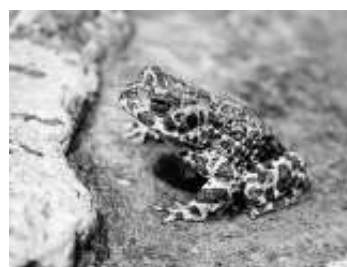
Die Wechselkröte ist gut getarnt.

Der Schönbuch-Naturführer Peter Schüle berichtet in einem Bildervortrag von den 15 Amphibien- und 7 Reptilienarten, die im Landkreis Böblingen leben. Neben ihrer Lebensweise werden unter anderem Themen wie die Bestandsentwicklungen, aktuelle Schutzprojekte und Ergebnisse aus der landesweiten Artenkartierung vorgestellt. Dem Schönbuch und seinen Randlagen kommt dabei eine besondere Bedeutung für den Erhalt von gefährdeten Arten im Kreisgebiet zu.