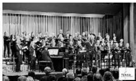
Wir freuen uns auf unseren Auftritt am 21. Oktober 2023 in Magstadt