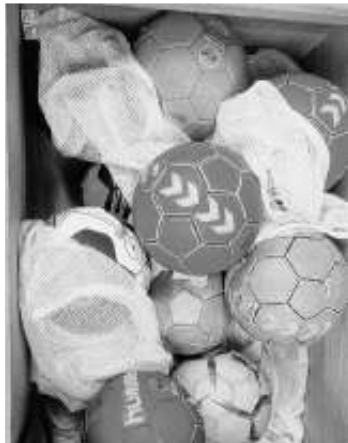
Abt. Handball