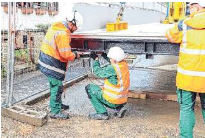
Letzte Arbeiten vor dem Einhub

In den nächsten Wochen werden die Arbeiten an der Stahlkonstruktion fortgeführt und im Dezember soll der Aufzug angeliefert werden, der dann voraussichtlich bis Februar 2024 fertig montiert und der Nutzung übergeben werden kann. Voraussichtlich im Dezember kann zumindest die Treppenanlage mit dem Steg für Fußgänger benutzt werden. Den genauen Termin werden wir in den Bondorfer Nachrichten rechtzeitig bekannt geben.