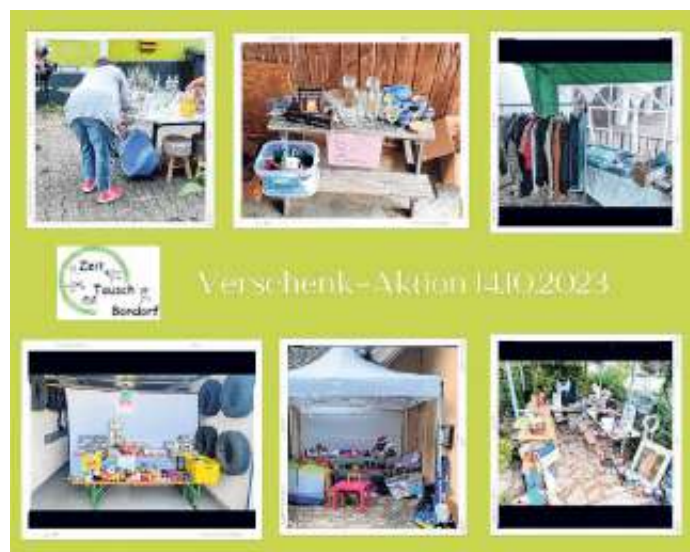
Verschenk-Aktion am 14. Oktober 2023

Kontakt: E-Mail: zeittausch@bondorf.de oder Telefon (0 74 57) 9 46 32 33