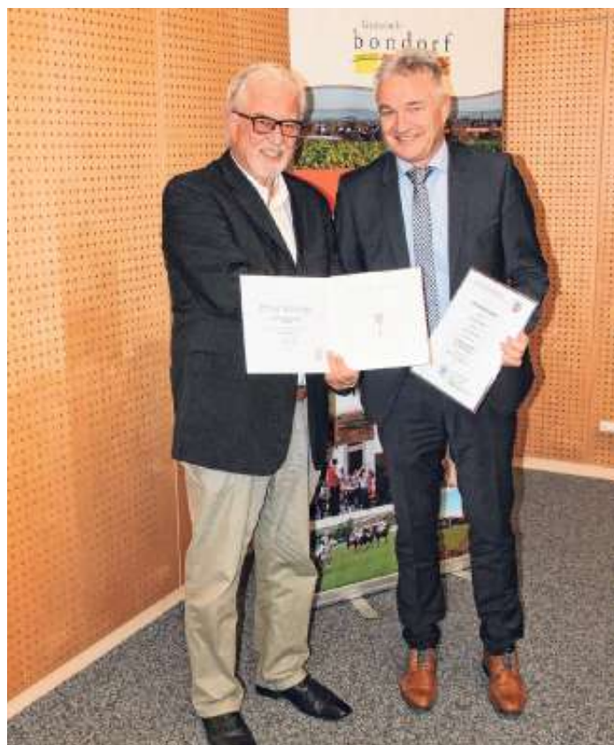
1. stellvertretende Bürgermeister Willi Gauß und Bürgermeister Bernd Dürr

Bürgermeister Dürr dankte für die wohlwollenden Worte. Er äußerte, dass aufgrund der guten Rahmenbedingungen durch ein hervorragendes und engagiertes Team bei der Gemeinde und durch die sachorientierte und konstruktive Beratung im Gemeinderat ein Umfeld vorhanden ist, in dem die Arbeit Freude macht und er sehr gerne das Amt des Bürgermeisters ausübt.