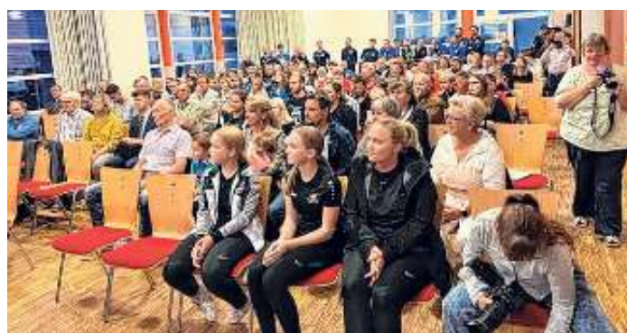
So groß war die Anzahl an zu Ehrenden beim Ehrungsabend in Jettingen noch nie.