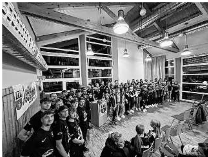
Alle VfLer am Ehrungsabend...Die "Blaue Wand"