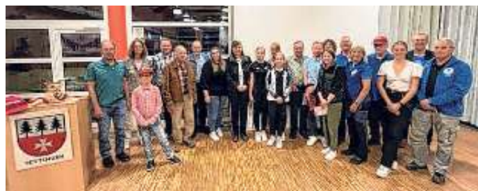
Erfolgreiche Bogenschützen, weltmeisterliche Agility-Sportlerinnen, ehrenamtliche MüllsammlerInnen, Kreismeisterin im Dressurreiten, tüchtige Kleintierzüchter und ein politisch engagierter Jugend-Guide.