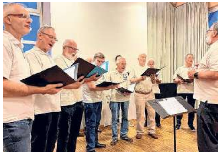
Der Liederkranz Oberjettingen umrahmte den Ehrungsabend stimmungsvoll.