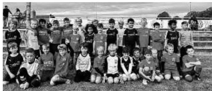
SG Jettingen Bambiniteams beim Heimturnier

E-J SG Jett. I – VfL Sindelf. IV (2014) 4:5 A-J SG Jett. – VfL Sindelfi. II 1:6 E-J SG Jett. II – SGM Nebri. 0:24 Die Bambinis hatten beim Heimspieltag einen tollen Tag. D-J TSV Altensteig – SG Jett. II 2:0 E-J SG Jettingen I – SGM Nufri. 4:3 D-J TSV Hildrizh. – SG Jett. I 0:7 C-J SG Jett. I – SV Affstätt 3:6 B-J SGM Waldd. – SG Jett. 3:2 A-J SV Böbl. II U18 – SG Jett. 4:4