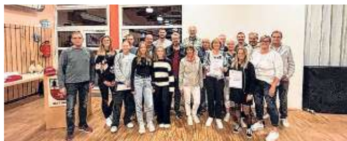
Der TC Jettingen war mit sechs Mannschaften beim Ehrungsabend vertreten.