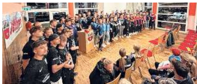
Alles blau. Der VfL Oberjettingen war mit seinen Fußballern, den Volleyballer/innen, den Tischtennisspielern und den Radfahrern erfolgreich.