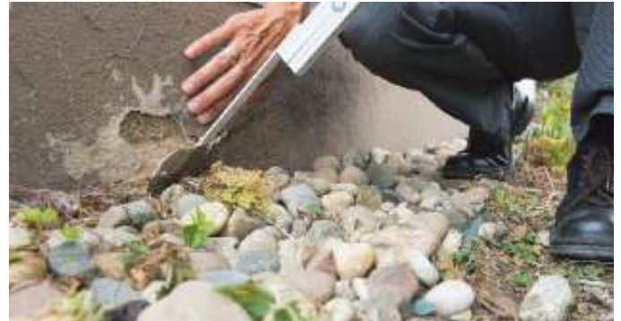
Schäden wie feuchte Sockel müssen gründlich saniert werden, wissen VPB-Sachverständige.