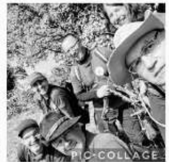
Schuss vom Hochstand