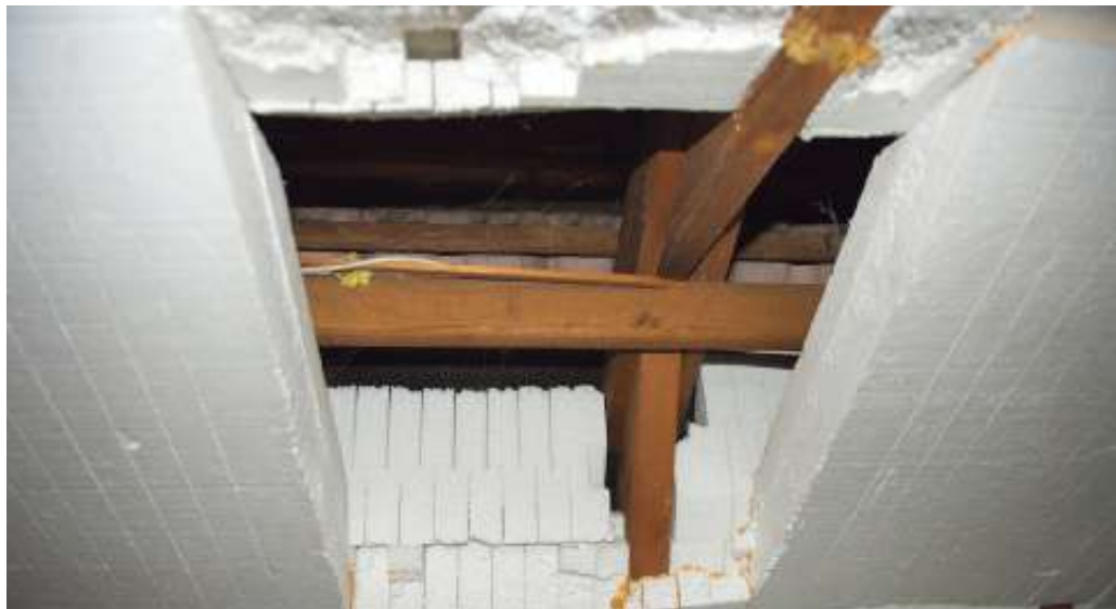
Viele Althausbesitzer haben in den vergangenen Jahrzehnten auf eigene Faust renoviert.

Der VPB schlägt jetzt Alarm, denn für Baulaien ergeben sich unabsehbar teure Konsequenzen, wenn eine Reform der Gefahrstoffverordnung so umgesetzt wird, wie sie momentan vom