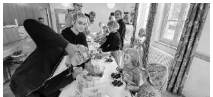
Kleine und Große „Kinder“ beim Pralinenrollen im Gemeindehaus