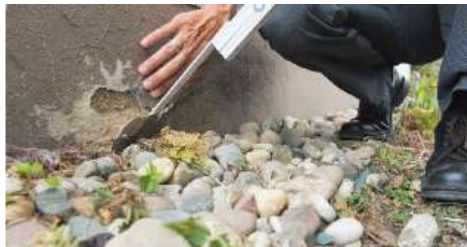
Schäden wie feuchte Sockel müssen gründlich saniert werden, wissen VPB-Sachverständige.