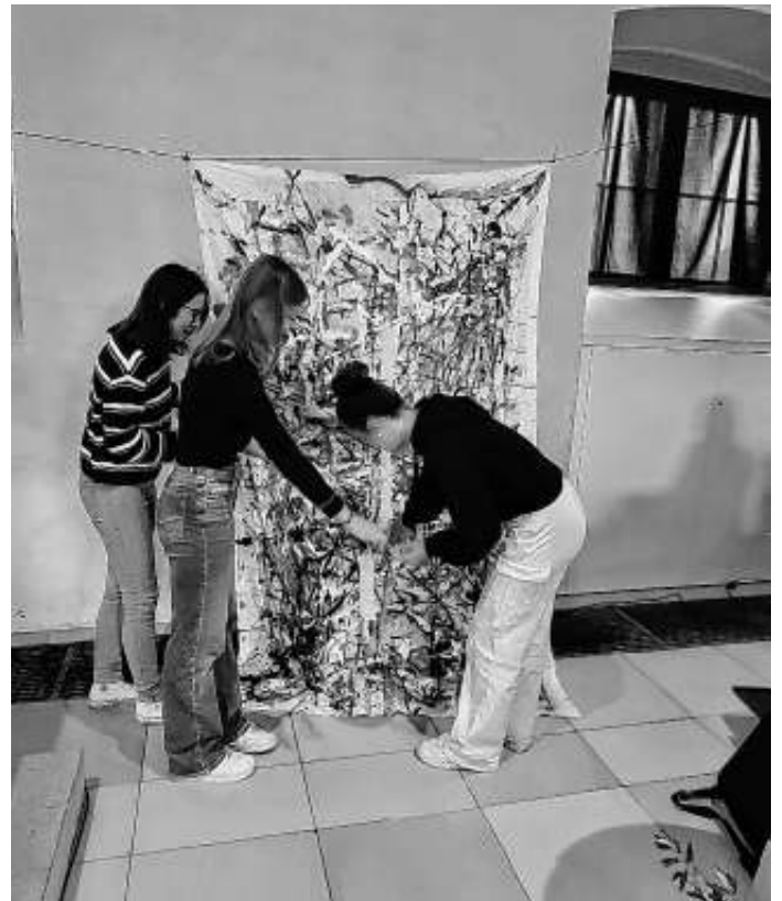
Im Gottesdienst vervollständigen die Jugendmitarbeiter das Action Gemälde der Jungschar

Im Nebenraum rollierte Konditorin Tati mit den Kindern ihre Brokadero – Pralinen. Dabei kamen wahre Kunstwerke zum Vorschein, die die Jungscharkinder und deren Geschwister dann in schönen Schachteln mit nach Hause nehmen konnten. Auch ein paar „größere“ Kinder hatten sich unter die Zuckerbäcker gemischt. Die Versuchung war zu groß.