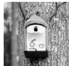
NABU R. Willers – Vogelnistkasten

Bei starken Regen fällt die Nistkastenreinigung aus.