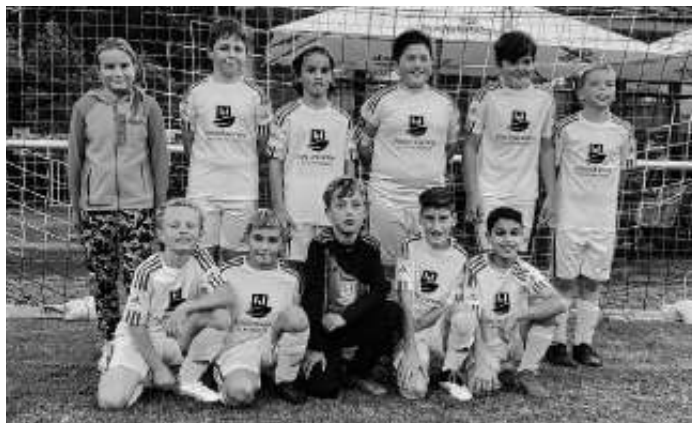
E-Jugend in Mönchberg Tolle Mannschaftsleistung beim ersten Punktspiel