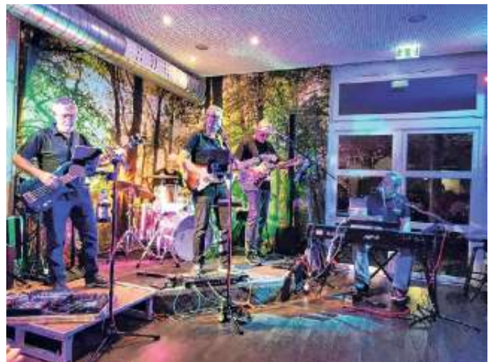
Jettingen, hier ist was los für jung und alt!

Der Dank aller gilt der Gemeinde Jettingen mit der Ü60 Initiative.