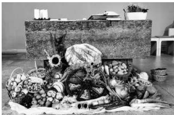
Erntedankaltar Jettingen

Wir feiern die Erntedankgottesdienste am 1. Oktober um 9.00 Uhr in Jettingen und um 10.30 Uhr in Nebringen.