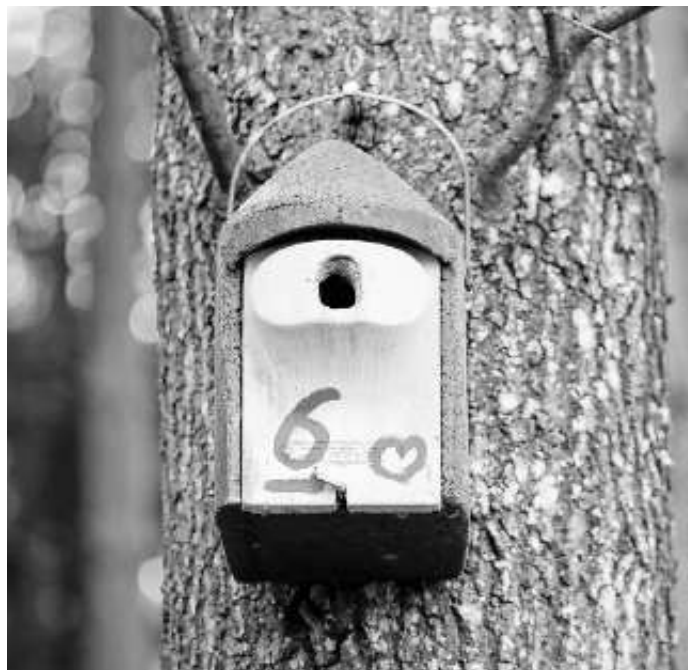
NABU R. Willers – Vogelnistkasten

Liebe NABU Mitglieder und Naturfreunde, der NABU Mötzingen-Gäufelden hat im Wald zwischen Mötzingen und Öschelbronn mehr als 250 Vogel- und Fledermauskästen aufgehängt. Wie jedes Jahr im Herbst müssen alle Nistkästen überprüft und gereinigt werden. Dazu suchen wir wieder viele freiwillige Helfer.