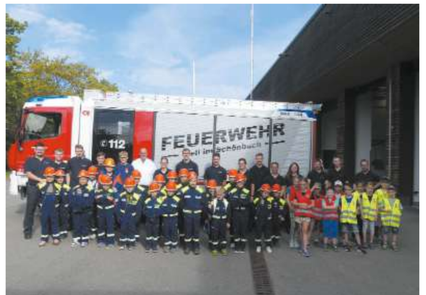
Lauter erfolgreicher Feuerwehrnachwuchs.