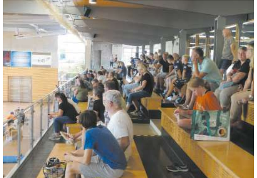
... vor gut gefüllten Zuschauerrängen.

Nach längerer Pause endlich wieder Handball-Genoba-Cup im Weiler Sportzentrum