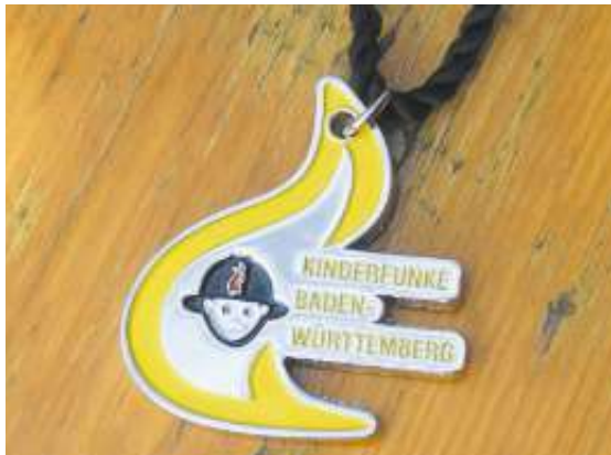
Das begehrte Abzeichen "Kinderfunke".

Seit zehn Jahren besteht die Kinderfeuerwehr Weil im Schönbuch und zählt aktuell zwölf Mädchen und Jungs zwischen sechs und zehn Jahren. Anlass genug, zum ersten Mal diese ganz besondere Abzeichenprüfung auszurichten. Mit an Bord geholt hatten sich die Weiler die befreundeten Kolleginnen und