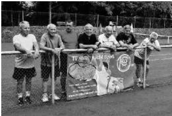
Fußballer hängen überm Zaun: mit Charly kann es anstrengend sein!

Einige der Spieler des Tennisclubs kommen aus der Fußballmannschaft im Ort und sind auch noch bei beiden Vereinen aktiv. So wurde es ein Doppel mit Spielern aus dem Verein und eine Trainingseinheit mit Charly. Danach brauchten alle Spieler dringend eine Dusche, innerlich wie äußerlich. Wenn auch nur wenige Spieler aktiv auf dem Platz waren, danach, beim gemütlichen Zusammensein mit den Partnern und den „Nichtspielern“ war dann das Restaurant bei „da Salvo“ gut ausgelastet. Bei Nudeln und einigen der übergroßen Pizzen klang der Abend aus wie er begonnen hatte: harmonisch!