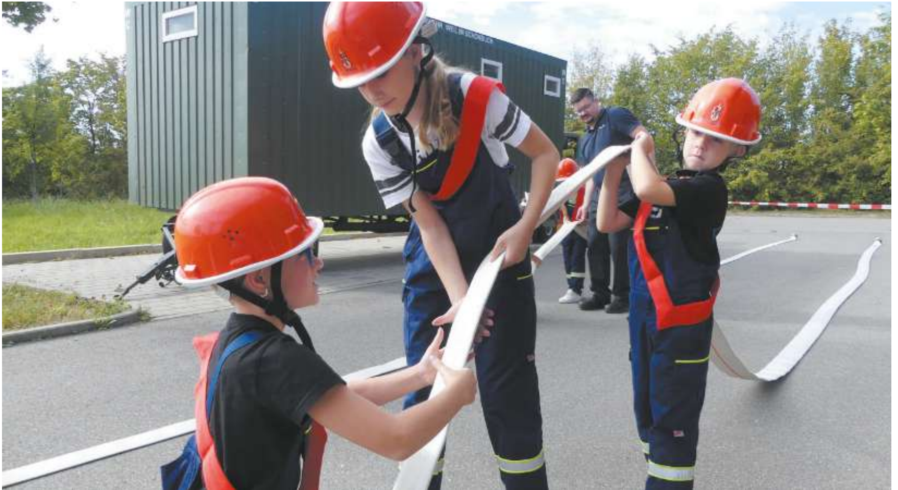
Früh übt sich, wer einmal ein großer Feuerwehrmann oder -frau werden will.

40 Mädchen und Jungs zwischen sechs und zehn Jahren machen das Kinderfeuerwehrabzeichen