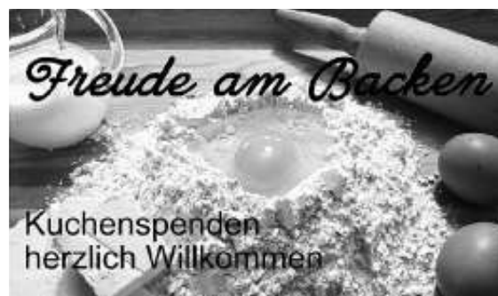
Kuchenspenden herzlich willkommen

Helfende-Hände sind herzlich willkommen. Für den Aufbau, den Bierstand zum Ausschank und für den Abbau hoffen wir zahlreiche GHV Mitglieder motivieren zu können. Bitte trägt Euch hierfür in der Liste ein die in den nächsten Tagen per Mail zugestellt wird.