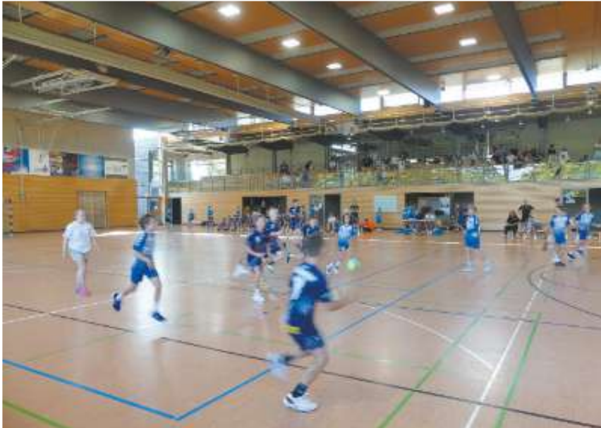
Der Genoba-Cup bot viel dynamischen Handballsport ...