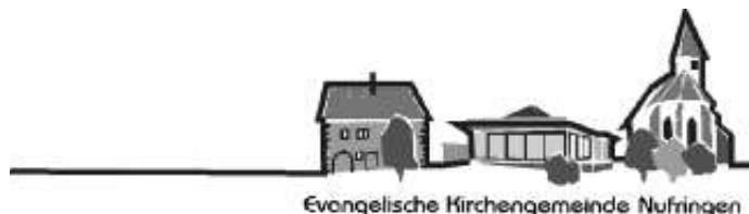
Evangelische Kirchengemeinde Nufringen