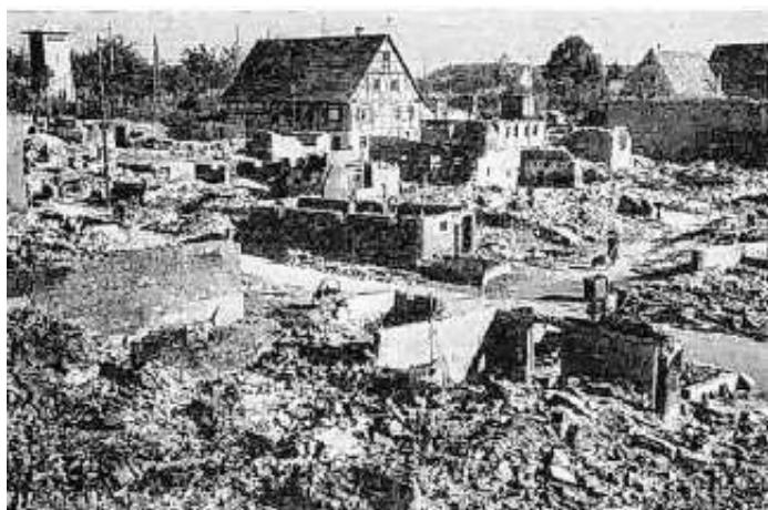
Nufringen nach der Bombennacht im Oktober 1943

Wenn Sie uns Fotos, gemalte Bilder und Schreiben von dieser Zeit für eine Kopie zukommen, finden diese ihren Platz in unserem ehrwürdigen Archiv und in einer zusammenfassenden Dokumentation.