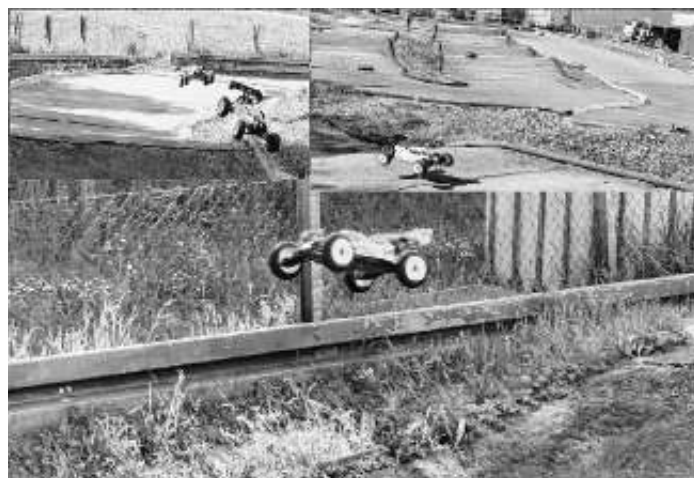
Impressionen von unserer Strecke im Hübschtanz