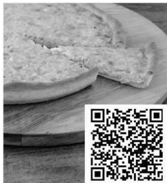
QR-Code für die Vorbestellungen

Ihr Musikverein Stadtkapelle Holzgerlingen