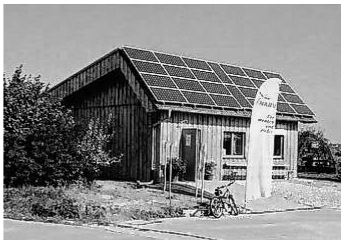
NABU Eutingen – Wachhäusle

Du möchtest vorab schon mal wissen, was bei dem Treffen auf dich wartet?