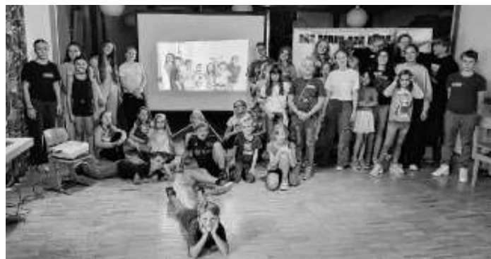
Gruppenbild mit Kindern aus Manila

Dann stellten sich alle noch zum Gruppenphoto auf, in der Mitte schonmal ein paar der Kinder aus dem Projekt in Manila auf dem Photo. Für die kommenden Monaten ist sicher die eine oder andere Lifeschalte geplant.