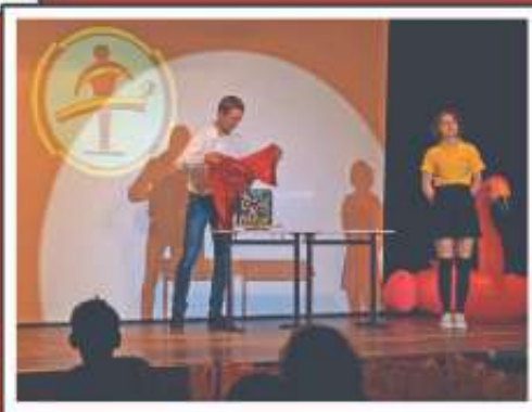
Zauber AG Schönbuch-Gymnasium

Samstag, 23. September 2023 Altdorf, Kirchplatz