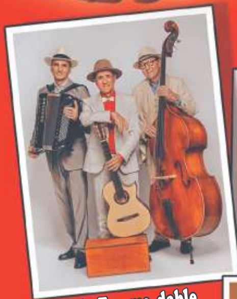
Le Trio For me-dable

Von 14 bis 19 Uhr - Eintritt frei Moderation: Philipp & Karl Göbel