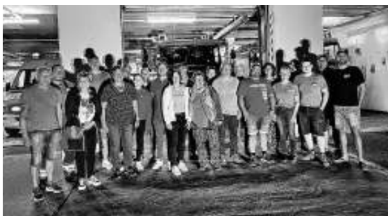
Gemeinsamer Abschluss im Feuerwehrhaus