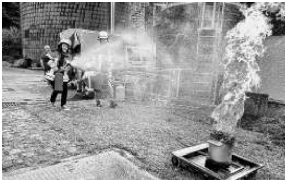
Brandbekämpfung mit dem Feuerlöscher