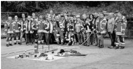
Gruppenbild nach der praktischen Übung

Wir bedanken uns recht herzlich bei allen Teilnehmern der Gemeindeverwaltung und dem Gemeinderat über das Interesse und die Unterstützung für die Arbeit der Feuerwehr Ehningen.