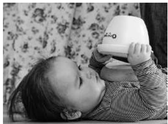
Schon Babys werden aus eigenen Erfahrungen klug

So wird das Leben für Eltern und Kinder leichter, schöner und friedvoller.