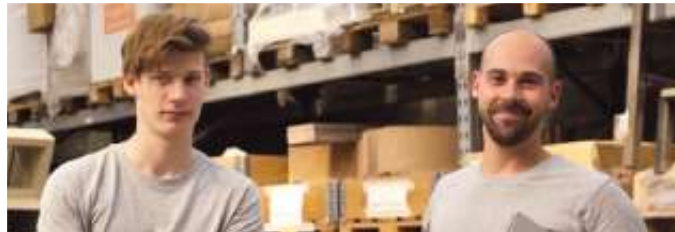
Viele Nachwuchskräfte kommen über ein Praktikum zu ihrem Beruf als Ofen- und Luftheizungsbauer.

etwas Berufserfahrung kann man seinen Meister machen, Fach- und Führungsaufgaben übernehmen und im Betrieb aufsteigen. Oder man wagt mit dem Meistertitel die Selbstständigkeit. Eine Weiterbildung als Techniker in der Fachrichtung Heizungs-, Lüftungs-, Klimatechnik ist ebenso möglich. Und ein nachfolgendes Bachelor-Studium im Studienfach Versorgungstechnik eröffnet weitere Karrierechancen. Einen #ofenhelden Infotalk findet man kostenfrei unter https://wir-sind.ofenhelden.info . Ofenbauer informieren hier über ihren abwechslungsreichen Beruf. Wer ihn kennenlernen möchte, sollte sich nach einem ein- oder mehrwöchigen Praktikum bei einem Ofenbauerbetrieb in der Nähe erkundigen, unter www.ofenhelden.info gibt es dazu mehr Informationen.