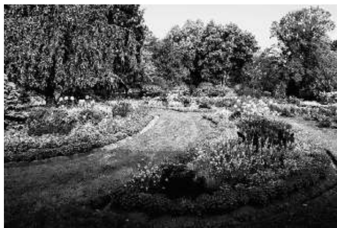
Gartenschau Balingen 2023

Werte und Träger von Kohlenstoff und Stickstoff folgen.