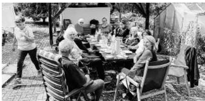
Bild Sommertreffen der Hospizgruppe