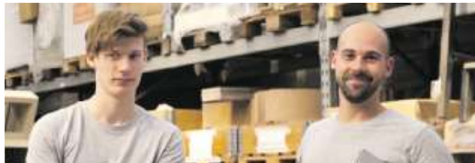
Viele Nachwuchskräfte kommen über ein Praktikum zu ihrem Beruf als Ofen- und Luftheizungsbauer.

etwas Berufserfahrung kann man seinen Meister machen, Fach- und Führungsaufgaben übernehmen und im Betrieb aufsteigen. Oder man wagt mit dem Meistertitel die Selbstständigkeit. Eine Weiterbildung als Techniker in der Fachrichtung Heizungs-, Lüftungs-, Klimatechnik ist ebenso möglich. Und ein nachfolgendes Bachelor-Studium im Studienfach Versorgungstechnik eröffnet weitere Karrierechancen. Einen #ofenhelden Infotalk findet man kostenfrei unter https://wir-sind.ofenhelden.info . Ofenbauer informieren hier über ihren abwechslungsreichen Beruf. Wer ihn kennenlernen möchte, sollte sich nach einem ein- oder mehrwöchigen Praktikum bei einem Ofenbauerbetrieb in der Nähe erkundigen, unter www.ofenhelden.info gibt es dazu mehr Informationen.