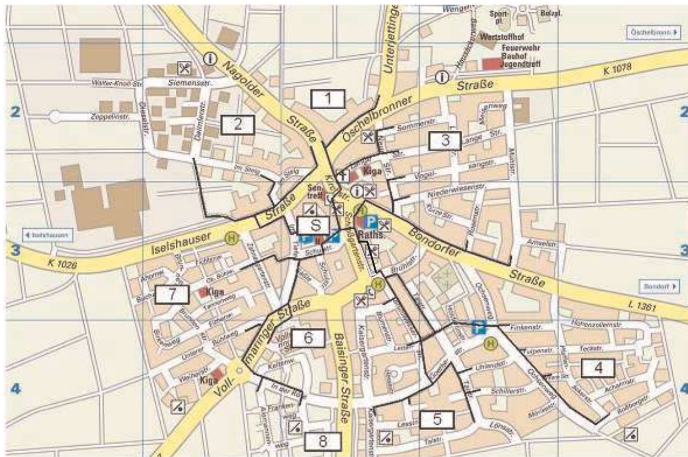
Schulwegplan der Gemeinde Mötzingen