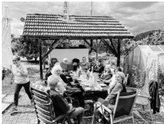
Das Sommertreffen der Hospizgruppe fand dieses Jahr in Mindersbach bei der Imkerei Volz statt.

Regelmäßige Gruppenaktivitäten stärken die Gemeinschaft des Teams.