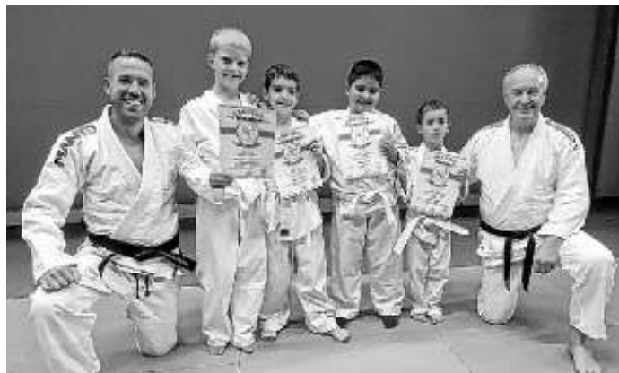
Jujutsukas mit Trainer

tigkeit bestanden. Groß war die Freude für alle Teilnehmer nach der erfolgreich bestandenen Prüfung. Alle anwesenden Trainer, Jujutsukas und Eltern haben die Jujutsukas herzlich beglückwünscht.