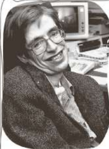
PROFESSOR S.W. HAWKING, MUSKELKRANKER PHYSIKER CAMBRIDGE

Praxis für Allgemeinmedizin und fg. Psychotherapie Holzgerlinger Straße 3, 71101 Schönnach Telefon 07031-651070, praxis@ott-lowatscheff.de