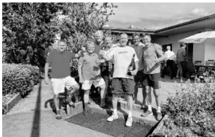
Herren 60 beim Sieg in Neuhausen

Hallo liebe Tennisfreunde, wir gratulieren den Herren 60 zur Meisterschaft und Aufstieg. Im letzten Spiel gegen den TC Neuhausen ließ die Mannschaft wieder nichts anbrennen und führte nach den Einzeln deutlich mit 4:2. Die Entscheidung fiel schnell in den Doppeln, zwei konnten deutlich in 2 Sätzen gewonnen werden, eines wurde im Match-Tie-Break verloren. Damit steigt die Mannschaft auf in die Oberliga. Dies ist das erste mal, dass eine Mannschaft unserer Tennisabteilung in solch einer Liga spielt.