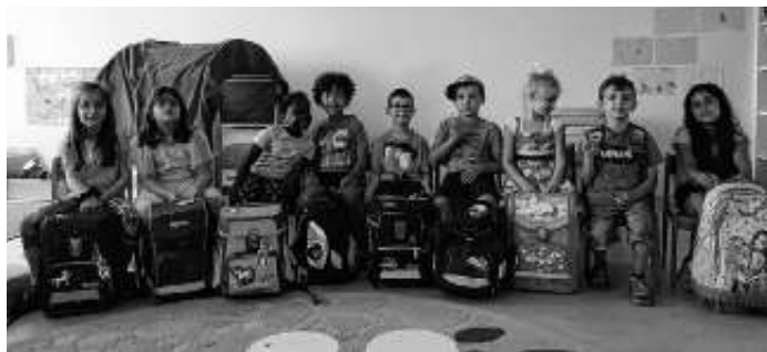
Unsere Dinos 2023

Das war ein schönes „letztes“ Beisammensein.