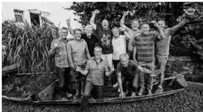
Herren 60 bei der Meisterschaftsfeier

Ein Glückwunsch geht ebenfalls an die Damen 2 . Im letzten Saisonspiel gelang ein souveräner Sieg gegen SV Bondorf 2 zur Meisterschaft. Das Team verlor in der Begegnung nur 2 Sätze und beendet damit die Saison ungeschlagen auf Platz 1.