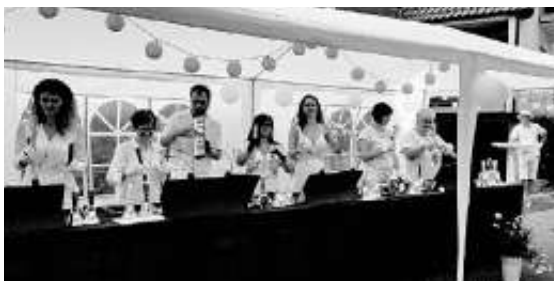
Für Unterhaltung ist immer gesorgt!

P.S: In weißer Kleidung macht die „Weiße Nacht“ noch viel mehr Spaß;) Wir freuen uns auf Sie!