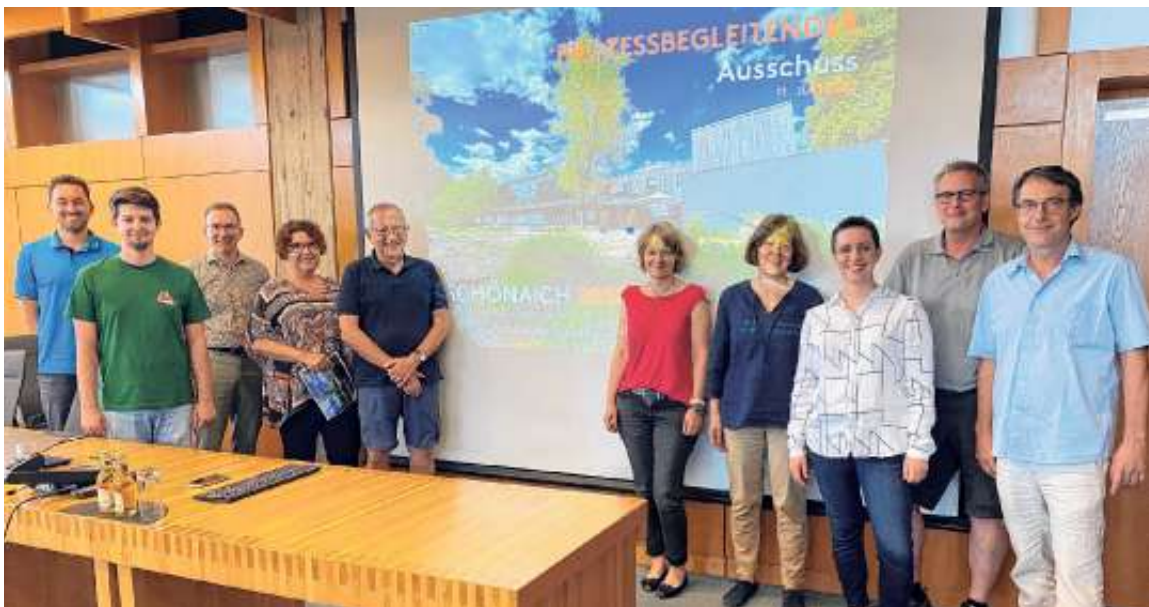
Mitglieder des prozessbegleitenden Ausschusses des Ortsentwicklungskonzepts und Vertreter der Planungsbüros Reschl und Zoll

Die Beschlussfassung zum Ortsentwicklungskonzept ist Ende des Jahres geplant. Der Prozess wird mit einer Bürgerinformationsveranstaltung abgeschlossen.