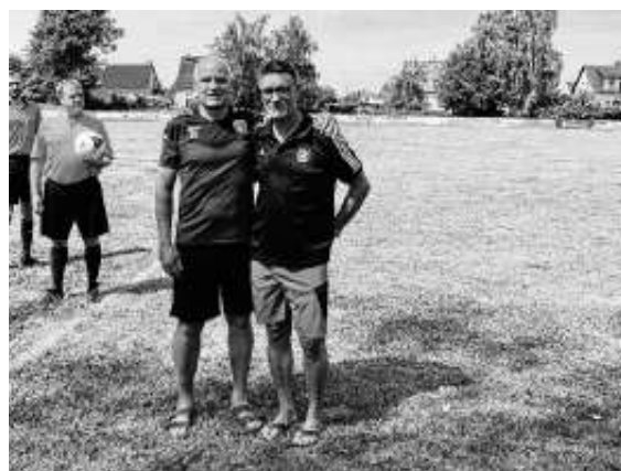
„Chefs de Mission“