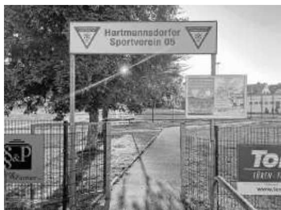
Das „Hartmannsdorfer Tor“