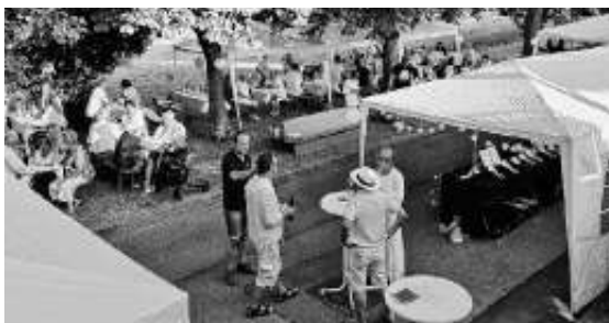
Im schattigen Grün und mit toller Aussicht aufs Röhrle schmeckts noch besser.