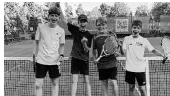
Unsere Junioren beim Feiern