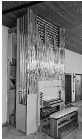
Orgel in Nufringen

Der Aufbau der neuen Orgel in Nufringen ist nun endlich abgeschlossen. Die Arbeiten waren wie geplant im Zeitrahmen. In den letzten Wochen stand die Intonation im Vordergrund, d.h. die Stimmung der Orgel und auch die Einstimmung auf den Kirchenraum in Nufringen.