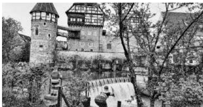
Das Zollernschloss in Balingen, davor liegen die Eyachterrassen der Gartenschau.

Am Mittwoch, 19. Juli 2023 fahren die LandFrauen mit öffentlichen Verkehrsmitteln zur Gartenschau nach Balingen. Die Anlagen erstrecken sich entlang des Flüsschens Eyach sind nicht allzu umfangreich aber nett angelegt. Gemütlich kann unter vielen hohen Bäumen im Schatten entlang der Eyach gebummelt und alles angeschaut werden. Ein Shuttlebus bringt einen dann wieder zurück zum Bahnhof. An diesem Mittwoch steht im Veranstaltungsprogramm u.a. im Treffpunkt Baden-Württemberg der Vortrag „Käse aus BW“ mit Kostproben und „Allgemeines Volksliedersingen mit dem Schwäbischen Albverein“. Wir haben uns neu informiert: mit einer Tageseintrittskarte zur Gartenschau kann im ganzen Naldogebiet kostenlos nach Balingen und zurückgefahren werden. Deshalb können wir ab Herrenberg mit der Ammertalbahn ohne zusätzliche Fahrkarte fahren. Wir werden am 19. Juli 2023 um 9.45 Uhr in Nufringen starten mit Fahrgemeinschaften. und sind dann um 11.30 Uhr in Balingen. Treffpunkt ist an der Bushaltestelle an der Ecke Herrenberger-/Kuppinger Strasse. In Herrenberg dann Einstieg auf die Ammertalbahn Abfahrt 10.18 Uhr und in Tübingen muss die Bahn gewechselt werden. Rückfahrt voraussichtlich gegen 17.00 Uhr. Tageskarte Eintritt 14 Euro. Wegen der Tageskarten bitte verbindlich bei Christine Henne Telefon (0 70 32) 8 24 78 oder E.-Mail: chhenne@gmx.de bis spätestens 18. Juli 2023 anmelden. Wir freuen uns über alle Mitfahrer.