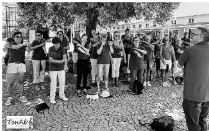
Wir singen uns schon mal ein...

Wir freuen uns sehr auf Ihr Kommen, Zuhören, Mitsingen und Feiern – und drücken uns allen die Daumen auf schönes Wetter.