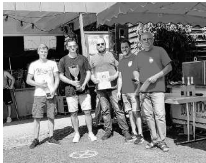
Siegeteam Bull Eye mit den beiden Vorständen