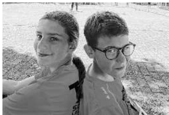
Das Warten will auch gelernt sein

Mit Wut im Bauch sprang er dafür gleich im ersten Sprung auf 3,88 m und somit auf Platz 11 in einem über 20 köpfigen Starterfeld.