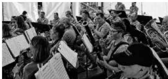
Das SBO auf der Bühne

Wir danken allen Helferinnen und Helfern, die uns während des Fests an einem unserer Stände unterstützt haben und auch beim Aufbau und beim Abbau. Es war eine gelungene Veranstaltung.