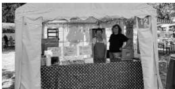
Der Verkaufsstand des AVS

Ein großer Dank an die Besucher und Zuhörer, die zum Gelingen des Festes beigetragen haben. Außerdem möchten wir uns ganz herzlich bei allen fleißigen Helferinnen und Helfern bedanken. Ohne diese Hilfe wäre ein solches Wochenende nicht machbar!