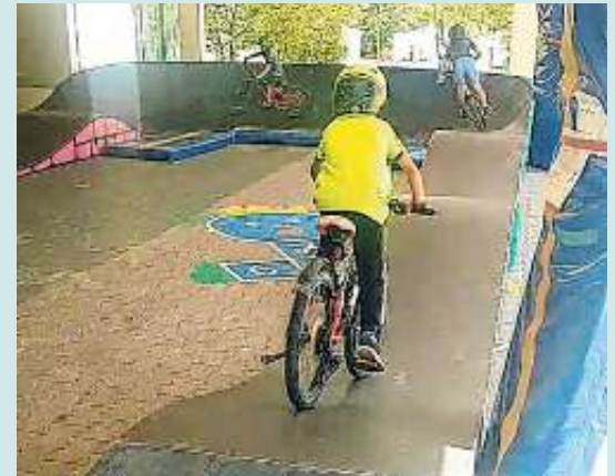
Pumptrack in Action

Weniger gefragt waren gedruckte Informationen zu Radtouren u.ä. während Gespräche zum Thema STADTRADELN und zu Radkultur allgemein im Rahmen des Sommerfestes immer möglich waren.