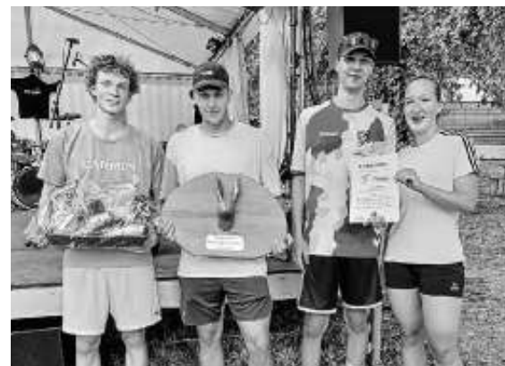
Die 1. Platzierten „Schmetterlinge“

Wir gratulieren dem Team der „Schmetterlinge“ nochmal herzlich zu ihrem verdienten Sieg und bedanken uns bei allen Mannschaften für ihre Teilnahme. Das Volleyball Turnier bei der Hasenbühl Hocketse war ein voller Erfolg und wird sicherlich noch lange in Erinnerung bleiben. Wir freuen uns bereits auf das nächste Jahr, wenn sich hoffentlich noch mehr Mannschaften dem sportlichen Wettkampf stellen werden.