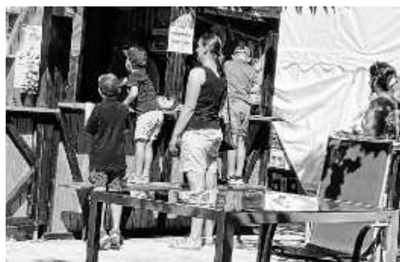
Das junge Publikum hatte viel Freude beim Dosenwerfen