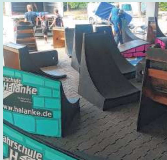
Pumptrack beim Aufbau