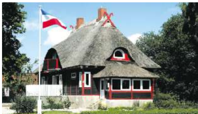
Bei hohen Anzahlungen hilft ein gesundes Misstrauen, bei Streitigkeiten eine Rechtsschutzversicherung.