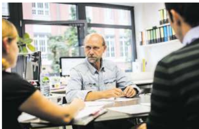
Eine unabhängige Beratung und Baubegleitung gibt Bauherren mehr Sicherheit.

steigen kann. Ein Großteil der Mängel - rund 85 Prozent - las-