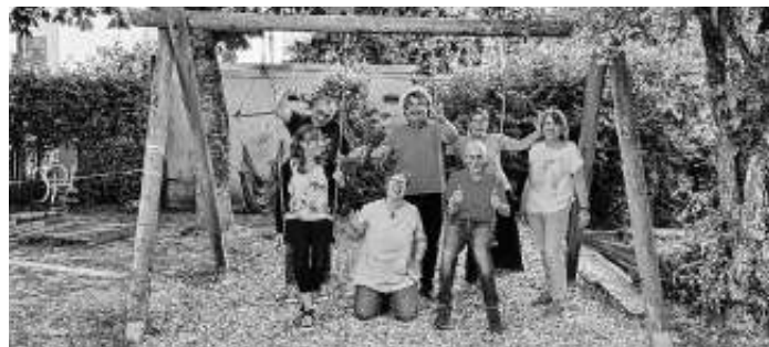
Das Ensemble für die Spielzeit 2023