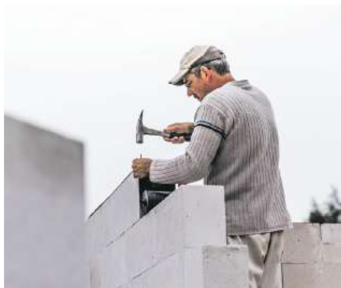
Die hohen energetischen Anforderungen an den Neubau machen das Bauen fehleranfälliger und teurer.