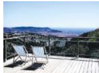
Sind alle Fragen rund um das Ferienhaus geklärt, kann der Erholungsurlaub beginnen. txn, txn-Foto: ferienwohnungen.de

Da das Angebot an Urlaubsdomizilen immer größer und unübersichtlicher wird, haben sich einige Anbieter bewusst für Qualität statt Quantität entschieden. Vermieter werden so zu den „besten Gastgeber der Welt“, um Gästen in ihren Ferien ein zweites Zuhause zum Wohlfühlen und Entspannen zu bieten. Auch diesbezüglich geben die Buchung über seriöse Anbieter und ein persönlicher Kontakt vorab ein gewisses Maß an Sicherheit. (txn/sel)