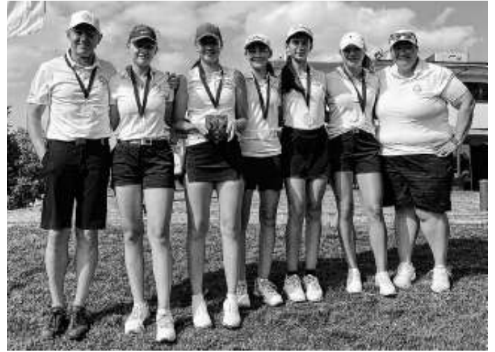
Flying Eagles Mädchen