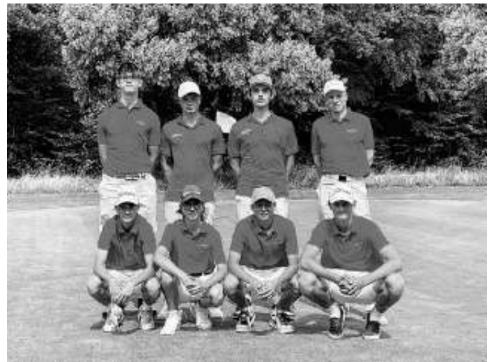
Flying Eagles Jungs