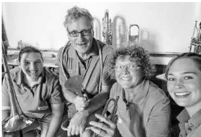
Bild: Posaunenchorbläser des CVJM Bondorf