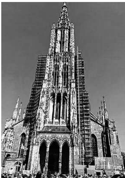
Das Ulmer Münster beim LaPo 2023

Wir freuen uns schon jetzt auf den nächsten – 50. Landesposaunentag – am 28./29. Juni 2025 in Ulm.