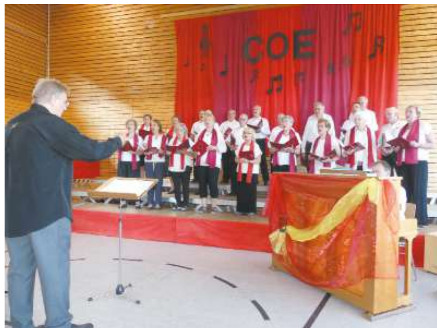
Ob die Gäste wie aus Dachtel (links) oder der gastgebende Chor aus Breitenstein: Beim COE-Wochenende kamen die Freunde gemeinschaftlichen Gesangs voll auf ihre Kosten.

Aus Anlass des COE-Jubiläums vier Chöre zu Gast in der Breitensteiner Halle