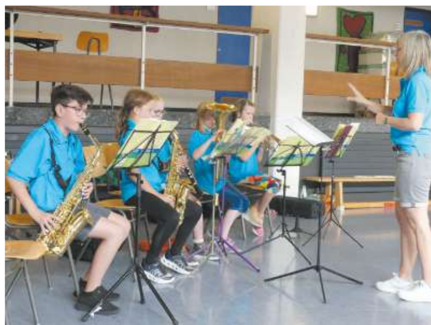
Für die Kooperationsschüler/innen war's ihr erster gemeinsamer Auftritt.