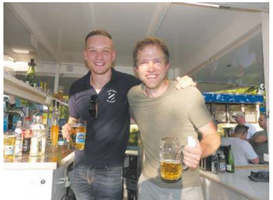
An kühlen Getränken herrschte kein Mangel.