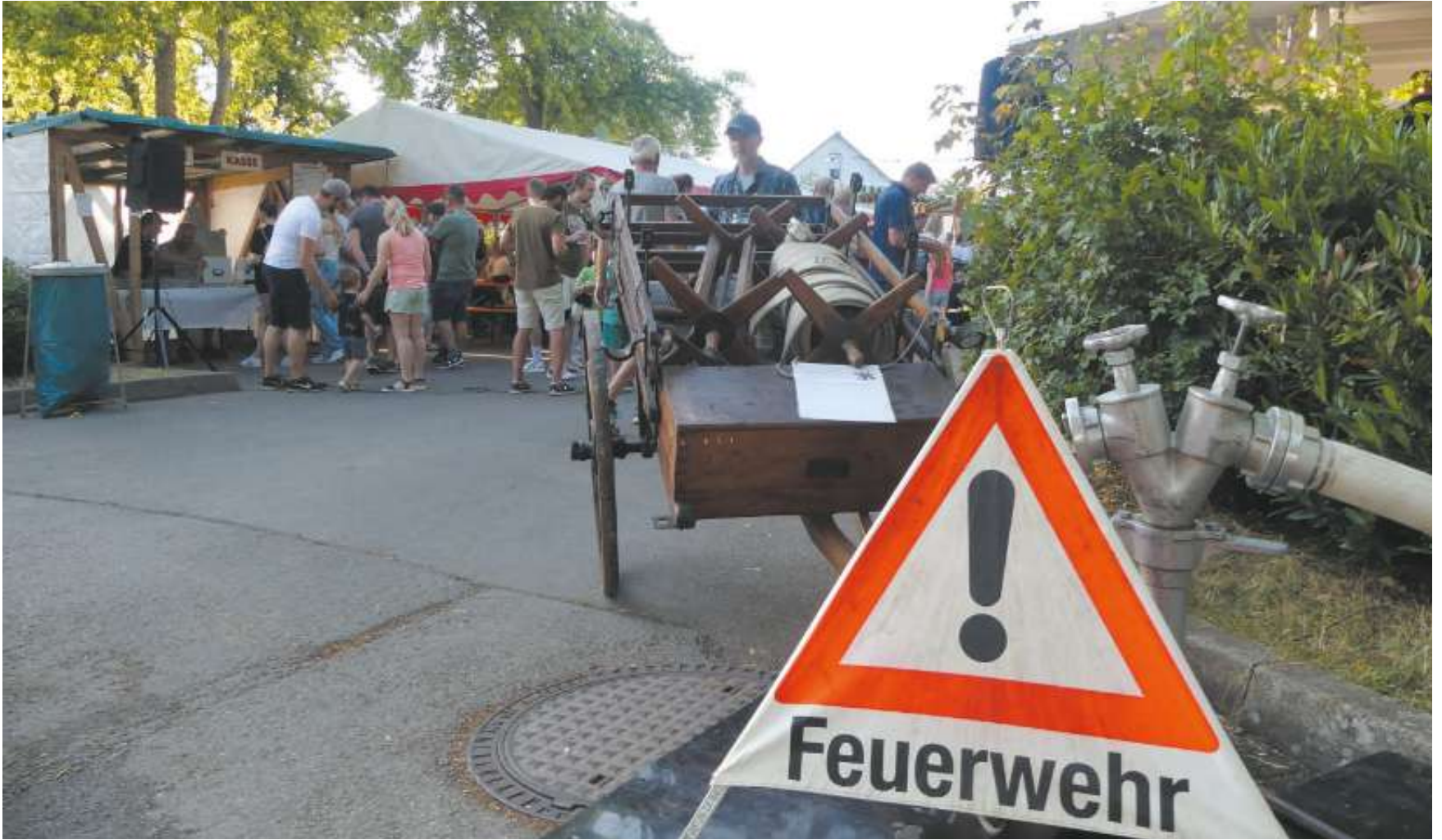
Bei der Feuerwehr Neuweiler wurde am vergangenen Wochenende wieder einmal so richtig gefestet.