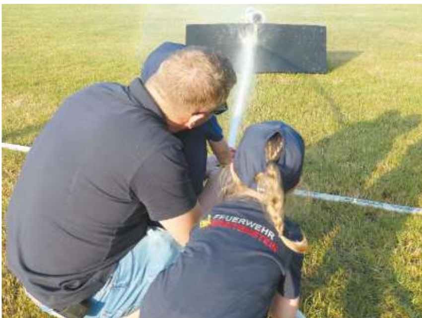
Wenn der Vater mit der Tochter die Feuerlöschspritze in Anschlag bringt.

Geschätzte 2.500 Besucher waren das ganze Wochenende über auf dem Neuweiler Festplatz hinter dem Feuerwehrhaus zu Gast und sorgten fast durchgängig für voll belegte Plätze an den Biertischgarnituren. Dazu hatte am Samstagabend bis nach Mitternacht die immer besonders beliebte "112 Bar" ihre Pforten geöffnet. Mit Live-Musik Stimmung machten außerdem der Musikverein Weil im Schönbuch und Cover Singer Tomi am Samstagnachmittag und -abend. Abgerundet wurde die Neuweiler Hocketse durch Fahrten mit dem Feuerwehrauto und Schauübungen, bei denen die Florianjünger ihre Einsatzbereitschaft und Leistungsfähigkeit demonstrierten.