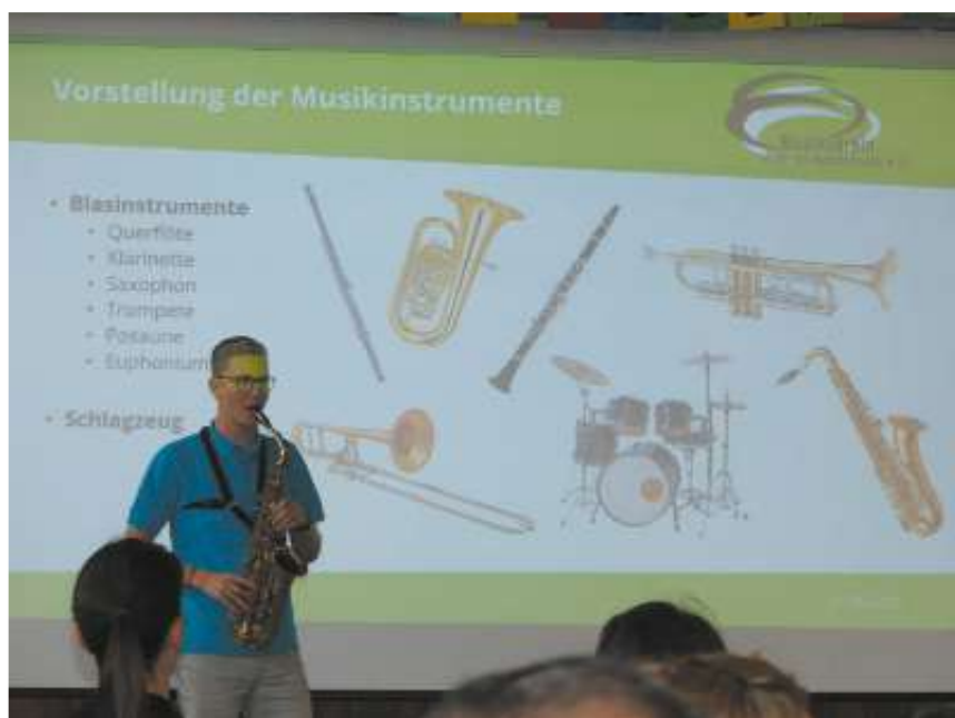
Mitglieder des Musikvereins Weil im Schönbuch präsentierten ihre Instrumente.