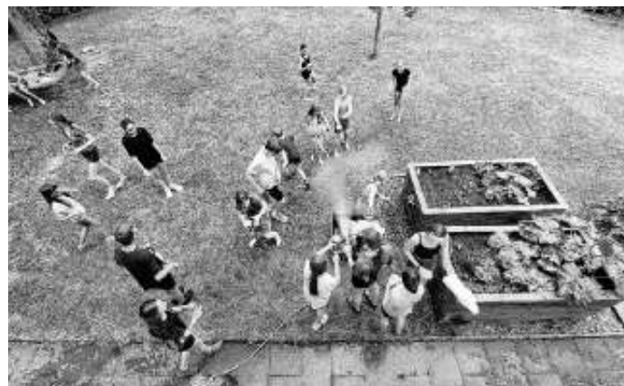
Wer den Schlauch hat ist im Vorteil