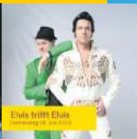
Elvis trifft Elvis Freitag 28. Juli 2023