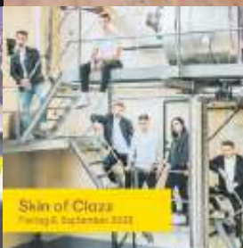
Skin ofClazz Freitag 8. September 2023

Ausführliche und aktualisierte Informationen sowie alle Neuigkeiten zu Sommer am See finden Sie hier: