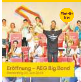
Eröffnung - AEG Big Band Freitag 22. Juni 2023

Stadt Böblingen Raum für Taten und Talente