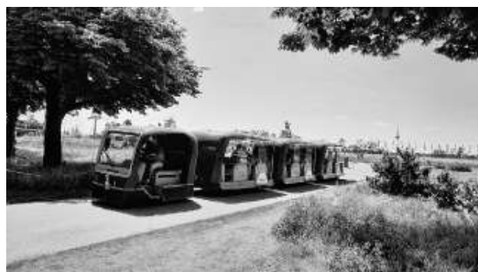
Mit dem Zügeln durch den Spinellipark.

Gut 6 Stunden hatten die LandFrauen Zeit um die riesigen Parkflächen der BUGA in Mannheim zu erkunden. Zuerst gondelten wir hoch über den Neckar hinüber zum ehemaligen Militärgelände auf dem der Spinellipark neu angelegt wurde. Hier ist man der Sommerhitze voll ausgesetzt da noch kaum schattenspendende Bäume vorhanden sind. Doch mit dem solarbetriebenen Zügeln konnten wir vor uns bequem bei einer Rundfahrt die Anlagen anschauen.