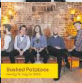
Bashed Potatoes Freitag 18. August 2023