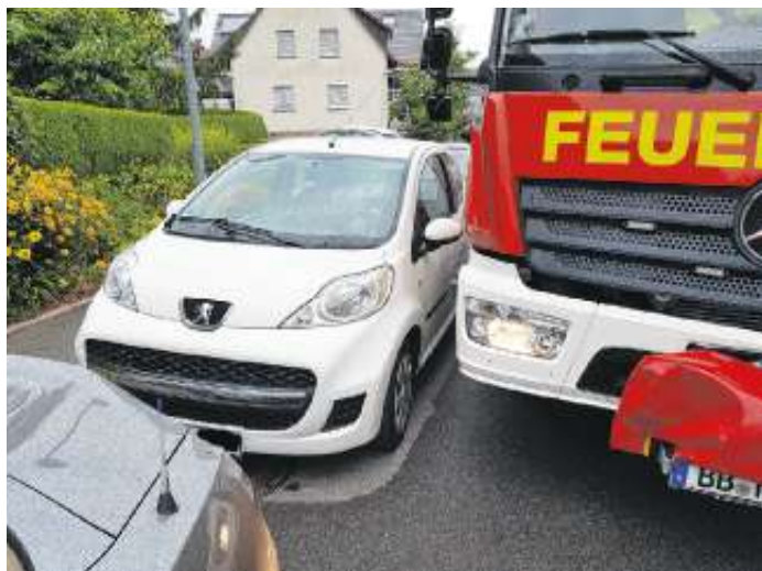
Kein Durchkommen für die Feuerwehr in der Marienstraße

Auf einer Fahrt mit der Freiwilligen Feuerwehr Nufringen (Gerätewagen) haben wir leider feststellen müssen, dass nicht in jeder beparkten Straße ein Durchkommen für das Feuerwehrfahrzeug möglich ist .