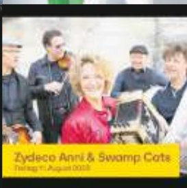
Zydeco Anni & Swamp Cats Freitag 11. August 2023