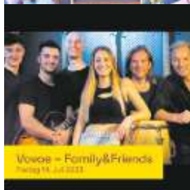
Vocals - Family&Friends Freitag 14. Juli 2023