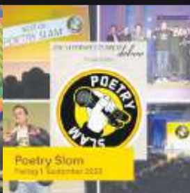
Poetry Slam Freitag 1. September 2023