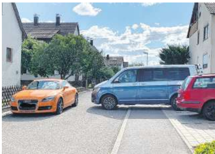
Zugeparkte Grundstücks- u. Tiefgaragenausfahrt Goethestraße

nach den Vorschriften der Straßenverkehrsordnung (StVO) verboten sein, so etwa vor Grundstücksein- und -ausfahrten und in schmalen Straßen .