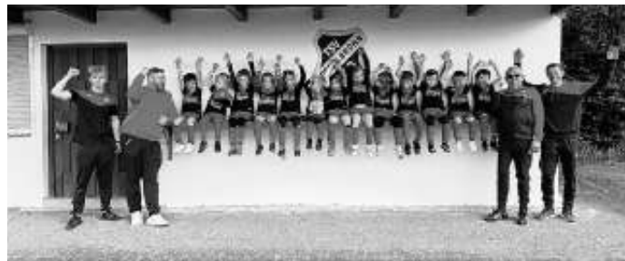
Bambinis in Öschelbronn