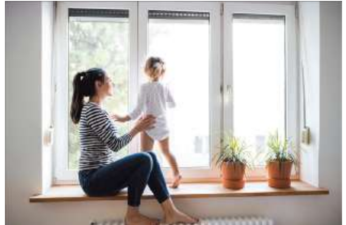
Moderne Wärmeschutzverglasung spart nicht nur Energie, sondern sorgt auch für ein behagliches Wohngefühl.

Auch Türen können zu Wärmebrücken werden. Eine moderne Haus- oder Wohnungstür sorgt dafür, dass die Wärme im Haus bleibt. Entscheidend ist beim Türentausch weniger das Material. Viel mehr kommt es auf den sogenannten Ud-Wert an. Er besagt, wie gut die Dämmeigenschaften der neuen Tür sind und sollte nicht über 1,8 W/m 2 K liegen. Strenger sind die Werte, wenn Eigentümer für den Türentausch entsprechende Förderprogramme nutzen möchten. Dann darf die neue Haustür einen Ud-Wert von 1,30 nicht überschreiten, so die Verbraucherzentrale. Und ebenso wie bei den Fenstern gilt: Der Einbau gehört in die Hände von Fachleuten, damit die Tür wirklich dicht schließt.