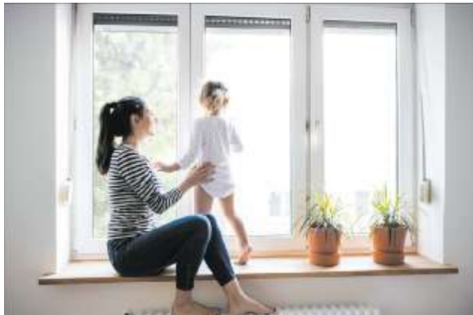
Moderne Wärmeschutzverglasung spart nicht nur Energie, sondern sorgt auch für ein behagliches Wohngefühl. txn, txn-Foto: Halfpoint/AdobeStock/vzbv

Auch Türen können zu Wärmebrücken werden. Eine moderne Haus- oder Wohnungstür sorgt dafür, dass die Wärme im Haus bleibt. Entscheidend ist beim Türentausch weniger das Material. Viel mehr kommt es auf den sogenannten Ud-Wert an. Er besagt, wie gut die Dämmeigenschaften der neuen Tür sind und sollte nicht über 1,8 W/m 2 K liegen. Strenger sind die Werte, wenn Eigentümer für den Türentausch entsprechende Förderprogramme nutzen möchten. Dann darf die neue Haustür einen Ud-Wert von 1,30 nicht überschreiten, so die Verbraucherzentrale. Und ebenso wie bei den Fenstern gilt: Der Einbau gehört in die Hände von Fachleuten, damit die Tür wirklich dicht schließt.