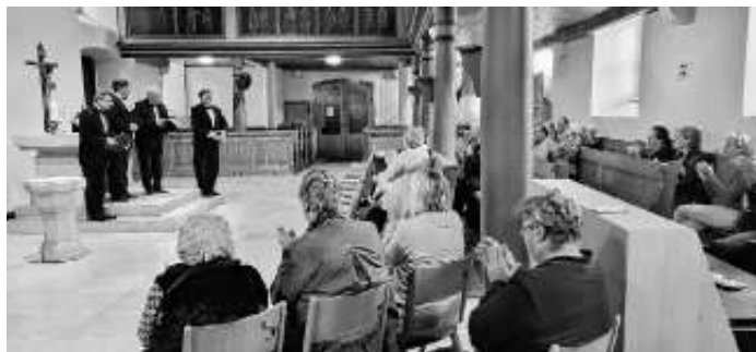
St. Petersburger Vokalensemble in der Mauritiuskirche

Beim anschließenden Sektempfang tauschten sich die z.T. langjährig Bekannten über die aktuelle Situation aus. Gut, dass die schrecklichen Nachrichten aus Kreml und Ukraine nicht das Einzige sind, was wir derzeit aus Russland hören, sondern mit dem Vokalensemble auch die jahrhundertealte christliche und volkstümliche Kultur des Osteuropäischen Landes in Mötzingen zu Ohren und ins Herz gesungen wurde.