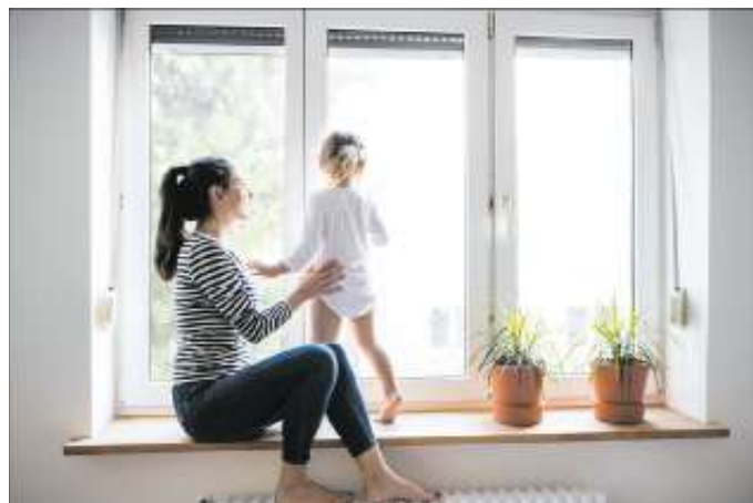
Moderne Wärmeschutzverglasung spart nicht nur Energie, sondern sorgt auch für ein behagliches Wohngefühl.

Auch Türen können zu Wärmebrücken werden. Eine moderne Haus- oder Wohnungstür sorgt dafür, dass die Wärme im Haus bleibt. Entscheidend ist beim Türentausch weniger das Material. Viel mehr kommt es auf den sogenannten Ud-Wert an. Er besagt, wie gut die Dämmeigenschaften der neuen Tür sind und sollte nicht über 1,8 W/m 2 K liegen. Strenger sind die Werte, wenn Eigentümer für den Türentausch entsprechende Förderprogramme nutzen möchten. Dann darf die neue Haustür einen Ud-Wert von 1,30 nicht überschreiten, so die Verbraucherzentrale. Und ebenso wie bei den Fenstern gilt: Der Einbau gehört in die Hände von Fachleuten, damit die Tür wirklich dicht schließt.