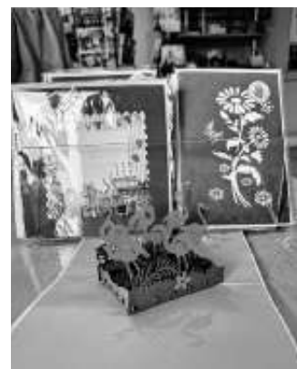
Pop-up-Karten aus Vietnam, Flamingos

In der Werkstatt wird auf die Rechte der Mitarbeiter*in- nen geachtet. Kinderarbeit ist verboten. Ein Teil des Gewinns wird für soziale Projekte in Deutschland und in Vietnam verwendet. Be- dacht werden damit Kinder, ältere Menschen und Fami- lien, die wenig oder keine staatliche Unterstützung er- halten.