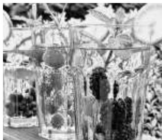
Beim nächsten Senior*innen-café geht es erfrischend zu.

Neben gemütlichem Beisammensein bei Kaffee, Kuchen und netten Gesprächen erwartet Sie wieder ein kurzweiliges und informatives Programm im Treff im Grund, Goerdelerstraße 2. Die Mitarbeiterinnen der städtischen Informations-, Anlauf- und Vermittlungsstelle (IAV) und des Pflegestützpunktes des Landkreises Böblingen laden dazu herzlich ein.