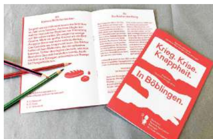
Interaktiver Rätselspaß mit Begleitheft zur Ausstellung.

Weitere Termine der Reihe „Kindern Krise erklärt“