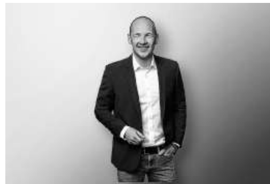
Der CDU-Bundestagsabgeordnete Marc Biadacz lädt zu seiner Bürgersprechstunde.

Die nächste Bürgersprechstunde findet am Dienstag, 6. Juni 2023, von 15.00 bis 16.00 Uhr in der Bäckerei & Konditorei Raisch in Dagersheim statt (Hauptstraße 11, 71034 Böblingen). Um Wartezeiten zu vermeiden, bitte ich um Anmeldung unter der Telefonnummer (0 70 31) 4 29 39 49 oder per E-Mail an marc.biadacz@bundestag.de .