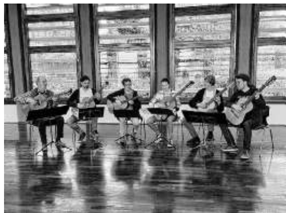
Sextett im Gitarrenorchester

Spielen Sie mit, hören Sie zu, unterhalten Sie sich mit uns – egal, wie Sie ihr Hobby neu beleben oder vertiefen. Kommen Sie einfach dienstags um 19.45 in die Justinus-Kerner-Schule in Böblingen oder nehmen Sie mit uns Kontakt auf. Ab Dienstag, 13. Juni 2023, proben wir wieder.