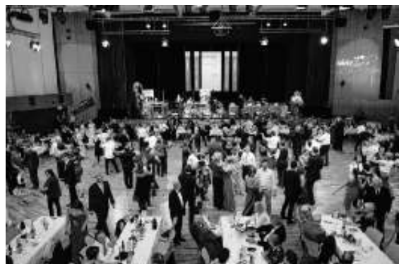
Perfekt gerüstet für den nächsten Ball mit unserem Workshop.

Vielleicht möchten Sie mit uns auch selbst einmal tanzen? Lernen Sie in unserem „Hochzeits-Workshop“ komprimiert die wichtigsten Grundlagen des Tanzens. Egal, ob für Ihre Hochzeit oder für einen Ball, nach dem Workshop bewegen Sie sich sicher auf jeder Tanzfläche.