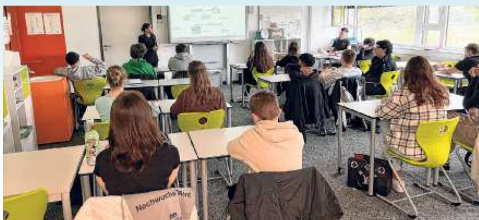
Vorstellung der verschiedenen Ausbildungsberufe

Nach zwei Schulstunden war die Aktion leider schon wieder vorbei und wir freuen uns auf das nächste Mal.