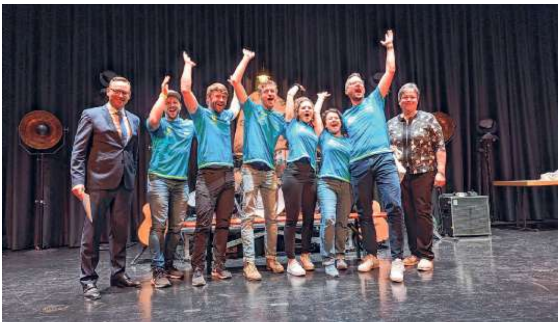
Ehrung der Volleyballmannschaft des TSV Ehningen Abteilung Breitensport