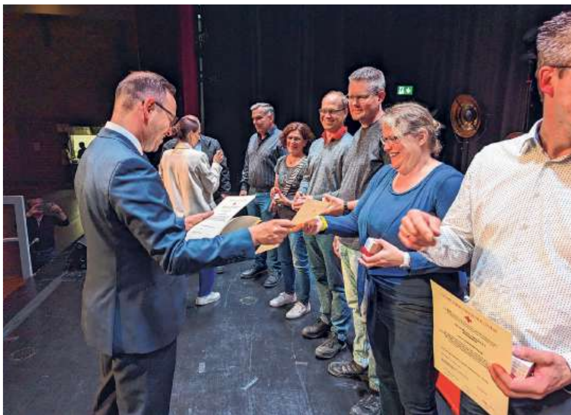
Die Geehrten erhalten ihre Urkunde und ihr Präsent, Foto: Gemeinde

Die Fotos aller Geehrten finden sich im dazugehörigen Online-Artikel auf der Gemeindehomepage ( www.ehningen.de ). Sie können dort bis zum 5. Juni heruntergeladen werden.