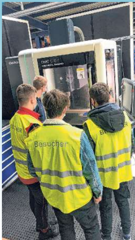
Betriebserkundung im Rahmen des Technikunterrichtes