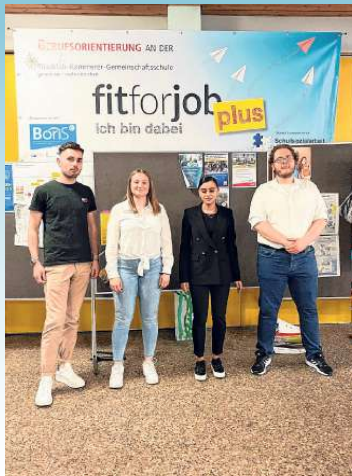
Die vier Ausbildungsbotschafter der Handwerkskammer