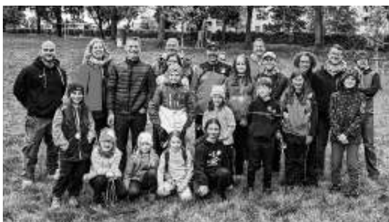
Gruppenfoto des TSV Ehningen