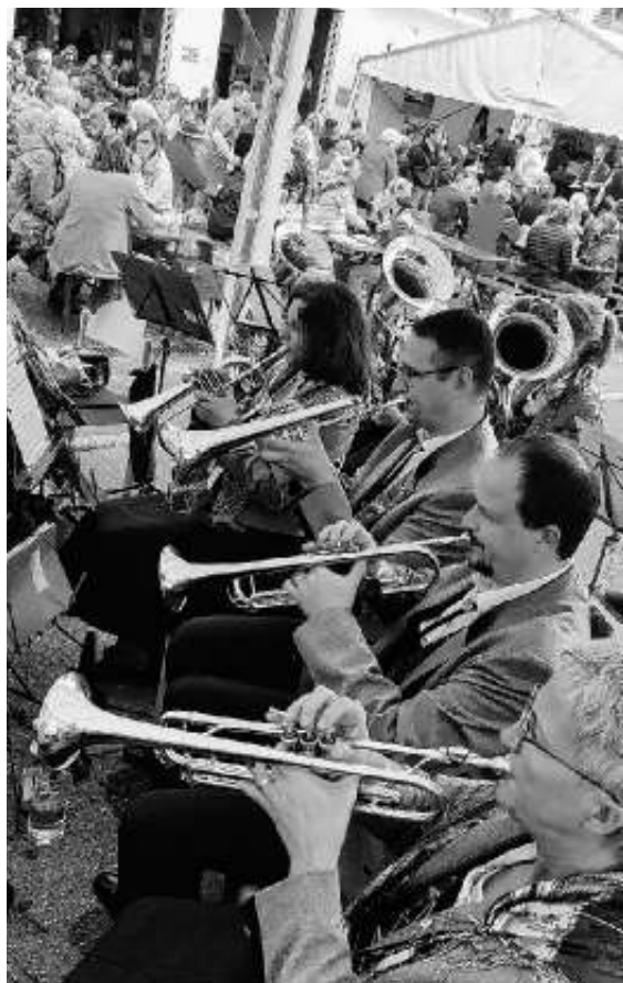
Das Trompetenregister im Einsatz

In diesem Monat war die Kapelle bei zwei Auftritten gefordert. Bei der FFW Ehningen und beim Haufest des Musikvereins Musberg.