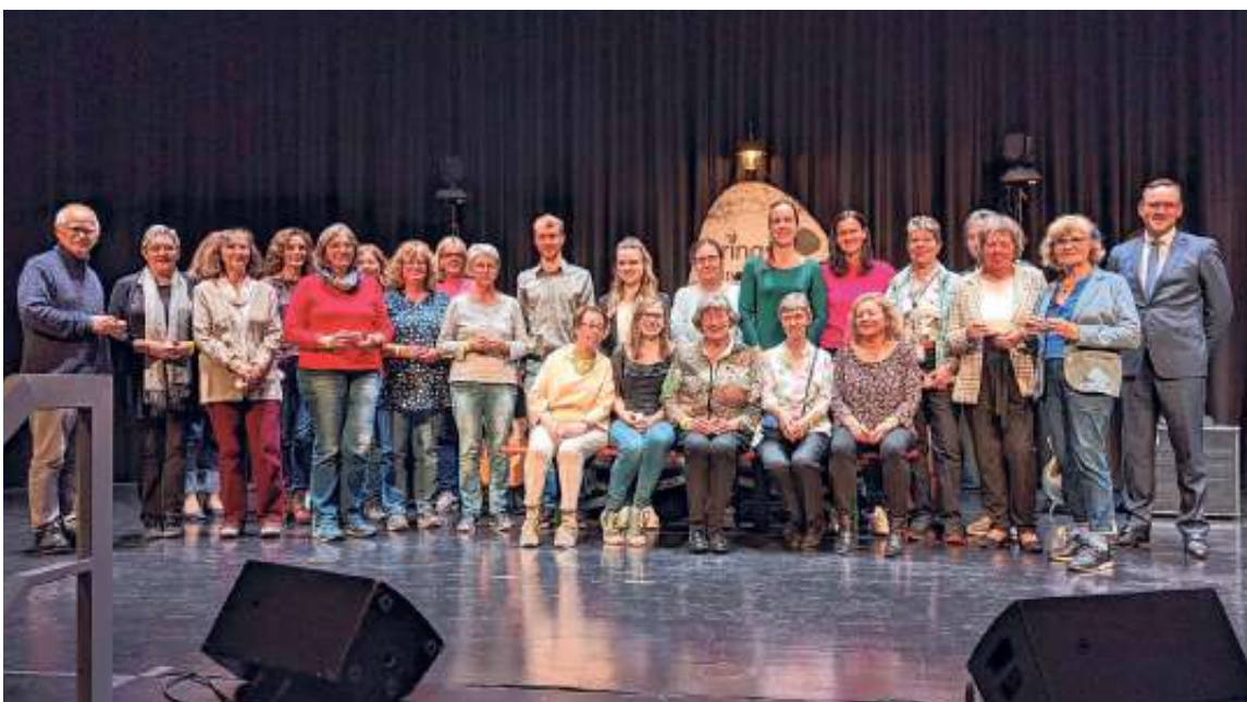
Team und Ehrenamtliche der Bücherei