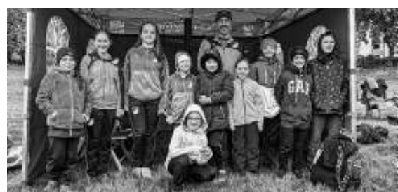
Die Schwimmer des TSV Ehningen in ihrem Zelt samt