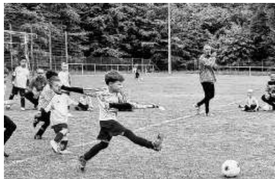
Bambinis in Mönchberg

Lasst uns weiter wachsen! Jeder ist uns jederzeit herzlich willkommen!