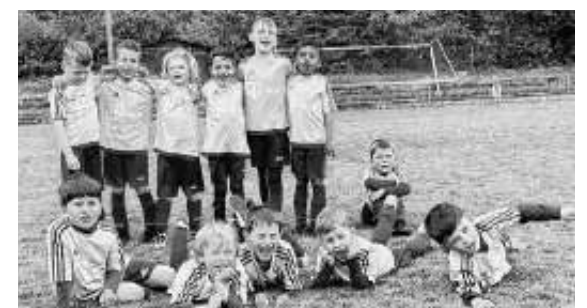
Bambinis in Deufingen