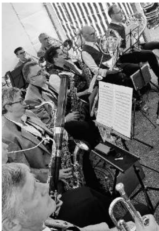
Musikalische Umrahmung bei der FFW Ehningen