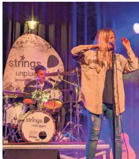
Musikalischer Abschluss mit „Strings Unplugged“, Foto: Gemeinde

Nach den zahlreichen Ehrungen folgte ein Live-Auftritt der Band „Strings Unplugged“. Das Herrenberger Quartett bot den Gästen zu den Hits von Fleetwood Mac über Tracy Chapman, Pink Floyd bis hin zu Sarah Connor einen musikalischen Abschluss, der zum Tanzen animierte.