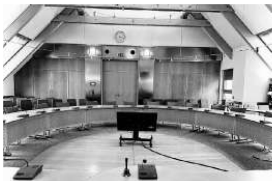
Ehninger Sitzungssaal

Die Sitze des Gemeinderats werden neu vergeben.