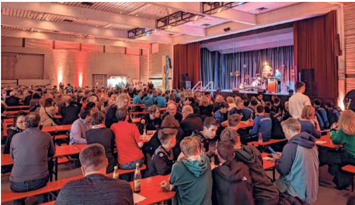
Eine volle Turn- und Festhalle, Foto: Gemeinde

Bürgerbeteiligung, Flüchtlingsbegleitung, Hausaufgabenhilfe, Café International, Interkultureller Gemeinschaftsgarten, Lesen auf der Empore, Bilderbuchkino, Lesepatenschaft, Kino im Theaterkeller, Unterstützung bei Ferienprogrammen und Tagesfreizeiten, INGA-Besuchsdienst, PC-Lernwerkstatt, uvm. – es folgte anschließend eine lange und in diesem Artikel nur verkürzt wiedergegebene Liste an Gebieten, in denen sich viele Ehningerinnen und Ehninger im vergangenen Jahr für das Gemeinwesen engagiert haben. Auffällig war dabei, dass einige Geehrte dabei wiederholt die Bühne betraten. Eine Besonderheit in diesem Jahr war, dass auch diejenigen Ehningerinnen und Ehninger geehrt wurden, die sich im Zuge der Corona-Pandemie ehrenamtlich engagiert hatten, z.B. beim Betrieb des Schnelltestzentrums oder bei der Einhaltung und Durchsetzung der Hygiene-Regeln bei Fußballspielen des TSV Ehningen.