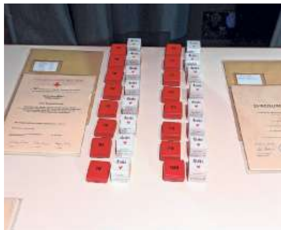
Urkunden, Ehrennadeln und Präsente für die geehrten Blutspenderinnen und Blutspender

Zum Abschluss durften beim diesjährigen Ehrungsabend die etwa 400 Gäste in der Turn- und Festhalle