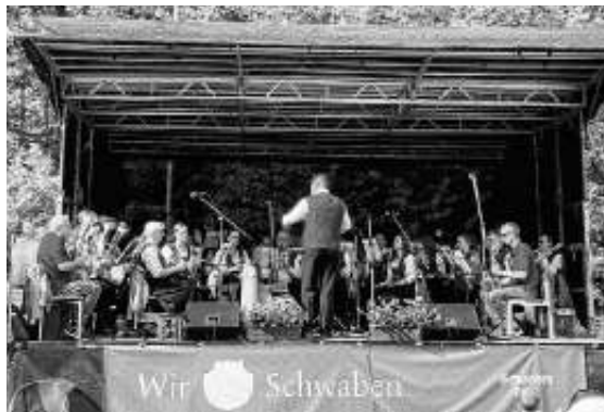
Der MVE auf der Bühne in Musberg