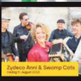
Zydeco Anni & Swamp Cats Freitag 11. August 2023