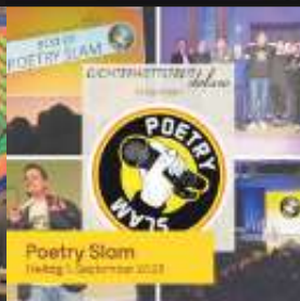
Poetry Slam Freitag 1. September 2023