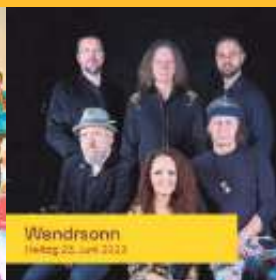
Wendrsson Freitag 23. Juni 2023