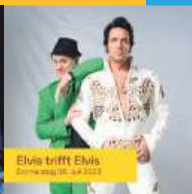
Elvis trifft Elvis Sonntag 25. Juli 2023