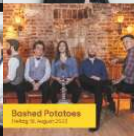
Bashed Potatoes Freitag 18. August 2023