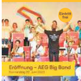
Eröffnung - AEG-Big Band Sonntag 27. Juni 2023

Stadt Böblingen Raum für Taten und Talente