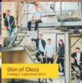
Skin ofClazz Freitag 8. September 2023

Ausführliche und aktualisierte Informationen sowie alle Neuigkeiten zu Sommer am See finden Sie hier: