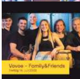
Vovoe - Family&Friends Freitag 14. Juli 2023