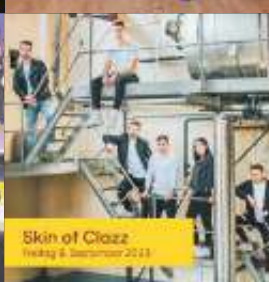
Skin of Jazz Freitag 8. September 2023

Ausführliche und aktualisierte Informationen sowie alle Neuigkeiten zu Sommer am See finden Sie hier: