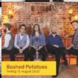
Bashed Potatoes Freitag 18. August 2023