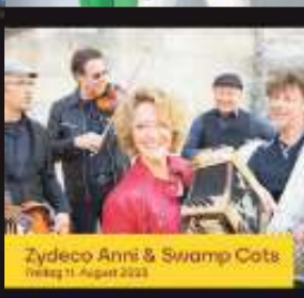
Zydeco Anni & Swamp Cats Freitag 11. August 2023