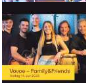
Vovoe – Family&Friends Freitag 14. Juli 2023