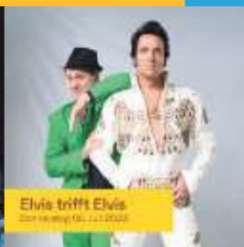
Elvis trifft Elvis Sonntag 25. Juni 2023