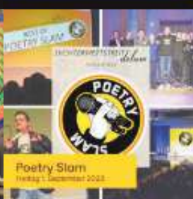
Poetry Slam Freitag 1. September 2023