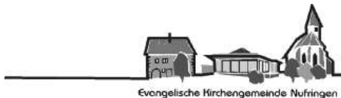
Evangelische Kirchengemeinde Nufringen