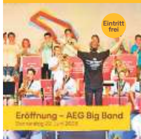
Eröffnung – AEG Big Band Donnerstag 22. Juni 2023

Stadt Böblingen Raum für Taten und Talente