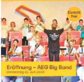
Eröffnung – AEG Big Band Donnerstag 22. Juni 2023

Stadt Böblingen Raum für Taten und Talente