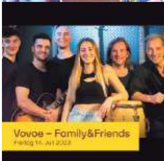
Vovoe – Family&Friends Freitag 14. Juli 2023