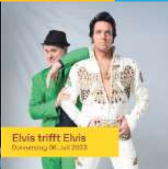
Elvis trifft Elvis Donnerstag 06. Juli 2023