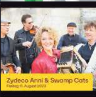
Zydeco Anni & Swamp Cats Freitag 11. August 2023