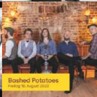
Bashed Potatoes Freitag 18. August 2023