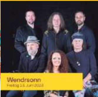
Wendrschonn Freitag 23. Juni 2023