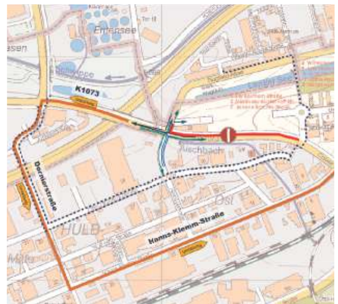
Plan 2: Sperrung und Fahrbeziehungen im 2. Bauabschnitt