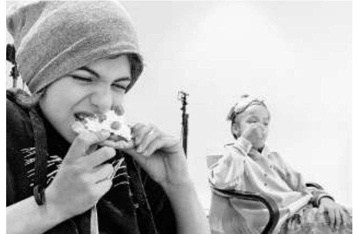
Den ersten beiden Testessern schmeckte es bei „jung & SATT“ hervorragend.