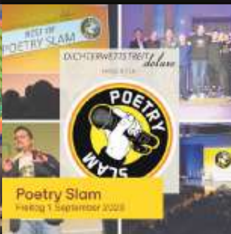
Poetry Slam Freitag 1. September 2023