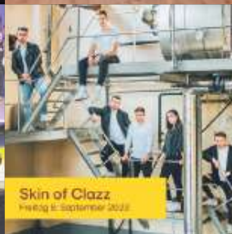
Skin of Clazz Freitag 8. September 2023

Ausführliche und aktualisierte Informationen sowie alle Neuigkeiten zu Sommer am See finden Sie hier: