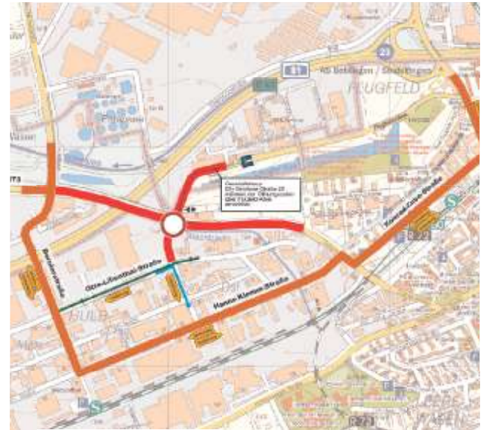
Plan 1: Einrichtung unter Vollsperrungen

Die Stadtverkehrslinie 731 sowie die Regionalverkehrslinien 743, 744, 763, 766 und N75 werden in beiden Richtungen über die Hanns-Klemm-Straße und Dornierstraße umgeleitet. Die Haltestellen Calwer Straße stadtauswärts und in beiden Richtungen die Haltestelle Calwer Straße/Hulf können nicht bedient werden. Als Ersatz dienen die Haltestellen Hanns-Klemm-Straße Ost und Heinkelstraße.