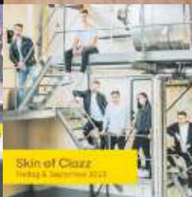
Skin ofClazz Freitag, 8. September 2023

Ausführliche und aktualisierte Informationen sowie alle Neuigkeiten zu Sommer am See finden Sie hier: