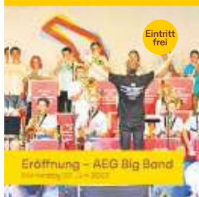
Eröffnung – AEG Big Band Freitag, 23. Juni 2023

Stadt Böblingen Raum für Taten und Talente