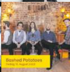
Bashed Potatoes Freitag, 18. August 2023