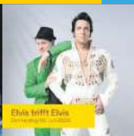
Elvis trifft Elvis Sonntag, 25. Juni 2023