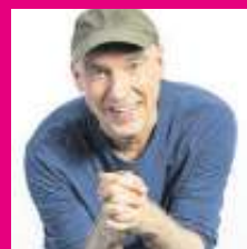
02.09. HG BUTZKO