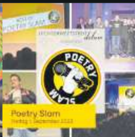
Poetry Slam Freitag, 1. September 2023