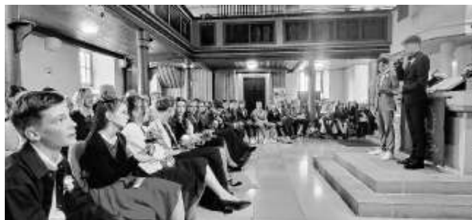
18 Konfirmanden stellen ihre Themen vor

Ziemlich viel Beteiligung gab es beim Konfirmationsgottesdienst am 14.5.. Nicht nur, dass wie üblich die Eltern im Vorfeld die Dekoration der Kirche organisierten. Nur die Stream Teilnehmer im Gemeindehaus und an den Bildschirmen waren sicher vor den Interviews der Jugendlichen: Schon für den ersten Beitrag („Wie gings Ihnen bei ihrer Konfirmation?“) gingen die Konfis auch auf die Empore der bis zum letzten Platz gefüllten Kirche.