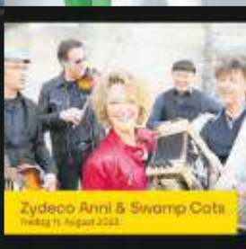
Zydeco Anni & Swamp Cats Freitag, 11. August 2023