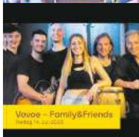
Vovoe – Family&Friends Freitag, 14. Juli 2023