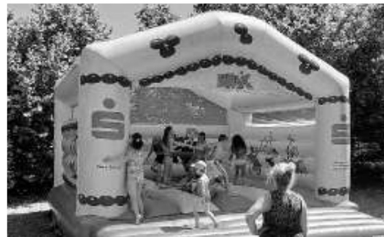
Hüpfspaß für alle jungen Badegäste

Vom 18. bis einschließlich 21. Mai gibt es wieder die Waldfreibad-Hüpfburg zum Spaß haben, Toben und Hüpfen.