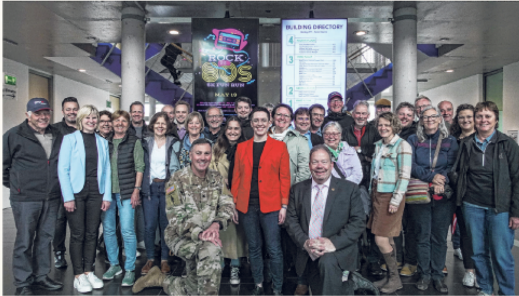
Eine Delegation aus Schönaich und der Partnerstadt Pfäffikon ZH (Schweiz) besucht die Panzerkaserne