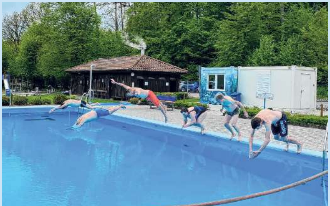
Mutige Wasserratten beim Sprung ins kühle Nass