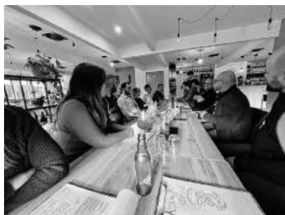
Erster GHS Stammtisch