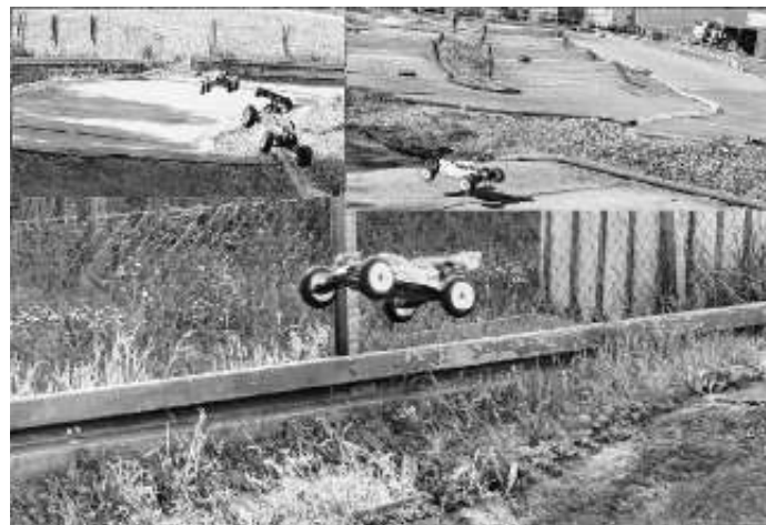
Impressionen vom letzten Wochenende