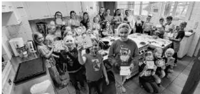
Süße Kugeln mit Tati: Viel Spaß mit Schokolade

Dabei konnten die Kinder ihre Kreativität frei entfalten. Weil nicht alle Kinder gleichzeitig in die Küche konnten, teilte man in drei Gruppen auf. Die erste Gruppe stellte die Pralinen her, die zweite bastelte hübsche Schächtelchen, die sie liebevoll verzieren konnten. Die dritte konnte sich im Pfarrgarten bei Gemeinschaftsspielen austoben.