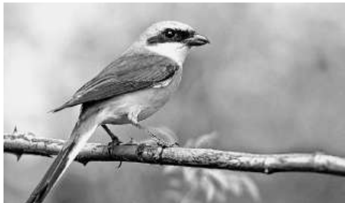
M. Bihler – Neuntöter

Liebe NABU Mitglieder und Naturfreunde, jedes Jahr am zweiten Maiwochenende sind alle Vogelfreunde aufgerufen, eine Stunde lang Vögel zu zählen und zu melden.