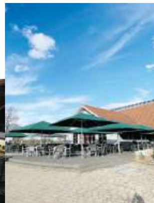
Aufgefrischt, gemütlich und mit reizvollem Blick ins Grüne lädt das neue Restaurant zum Besuch ein.