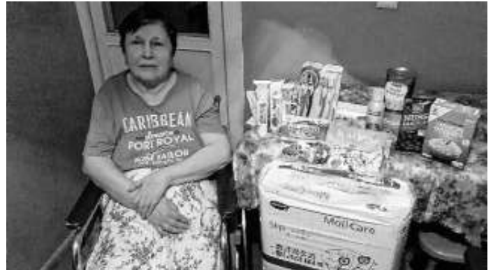
Ihre Spende im Pflegeheim

Ein Teil Ihrer wunderbaren Spenden sind an ein Altenpflegeheim in der Nähe von Lwiw weitergereicht worden – ganz besonders dankbar angenommen wurden hier die Hygieneartikel und die Fertiggerichte! Dort werden inzwischen auch Menschen untergebracht, die Ihr Zuhause verloren und keine Verwandten mehr haben.