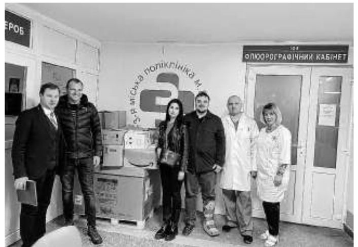
Willkommene Hilfe im Krankenhaus

Aus der Ukraine und vom ganzen Helfer-Team nochmals ein HERZLICHES DANKESCHÖN an alle kleinen & großen Spenderinnen und Spender! Vielen Dank auch an die Evangelische Kirchengemeinde für die Unterstützung der Spendenaktion und die tolle Zusammenarbeit!