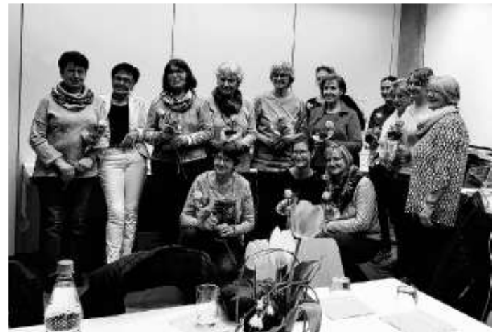
Jahreshauptversammlung – 26.04.2023

Wir werden Fahrgemeinschaften bilden. Daher wollen wir Euch um Ihre Anmeldung bitten. (07452)7196 oder (07452)7 59 02