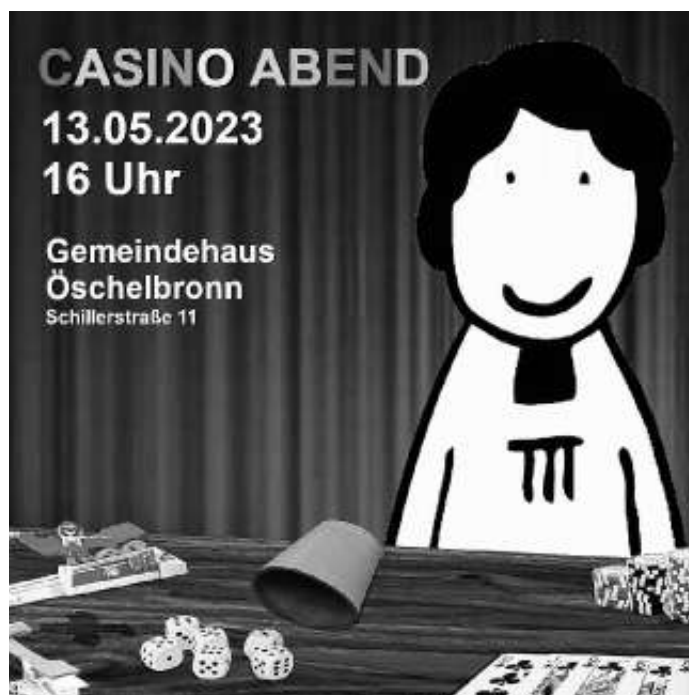
Plakat privat: Casino Abend Minis Gäu

Am Samstag, 13. Mai 2023 ab 16.00 Uhr im Gemeindehaus in Öschelbronn – nähere Infos zu diesem tollen Event auf www.klig.de oder direkt unter: minis@klig.de . Seid mit dabei – die Oberminis und Minis freuen sich auf euch!