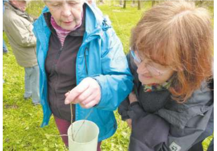
Noch ganz unscheinbar: Die erst einjährige Moorbirke.