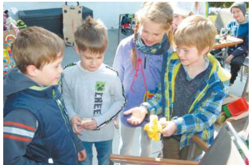
Früh übt sich - auch das Feilschen um den richtigen Preis will gelernt sein.