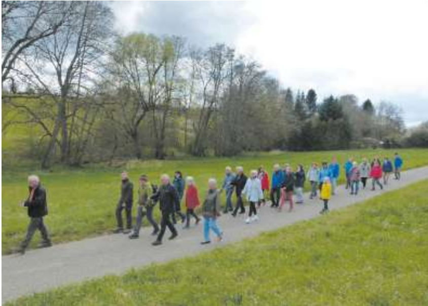
Mehr als 30 Wanderer machten sich auf den Weg zum Baum des Jahres.