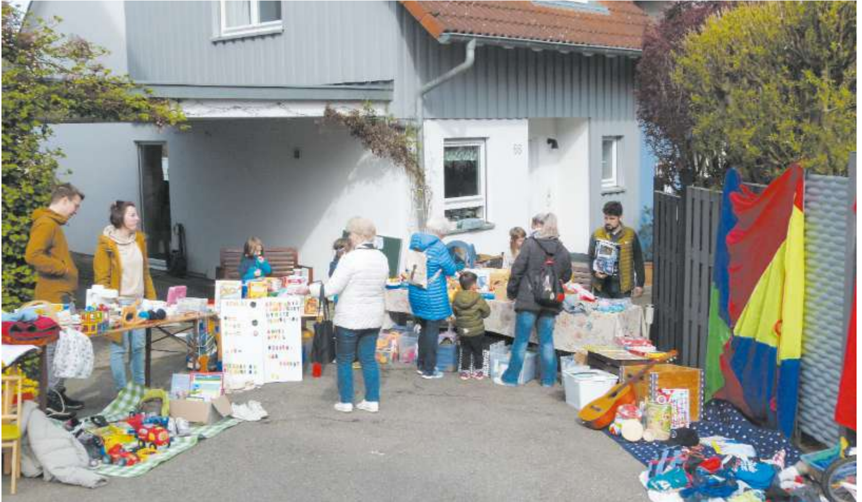
Der ganze Ort ein einziger Flohmarkt - so sah es am vergangenen Samstag in Neuweiler in nicht wenigen Höfen und Gärten aus.

34 Teilnehmer beim ersten Hof- und Gartenflohmarkt in Neuweiler