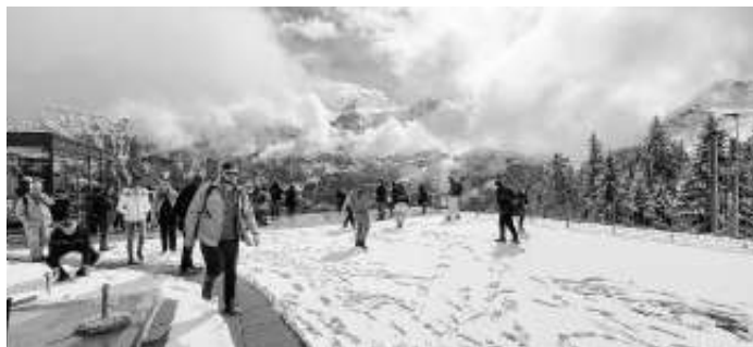
Neuschnee Mitte April: Eine Schneeballschlacht steht an.

Zurück am Thuner See empfing die Gruppe wieder Frühling mit Magnolienblüte und frisch ausgetriebenen Bäumen, daneben die Gastfreundschaft der Christusträger Brüder, die sich dieses historische „Schlössli“ vor 40 Jahren erworben und für den Gästebetrieb renoviert hatten.